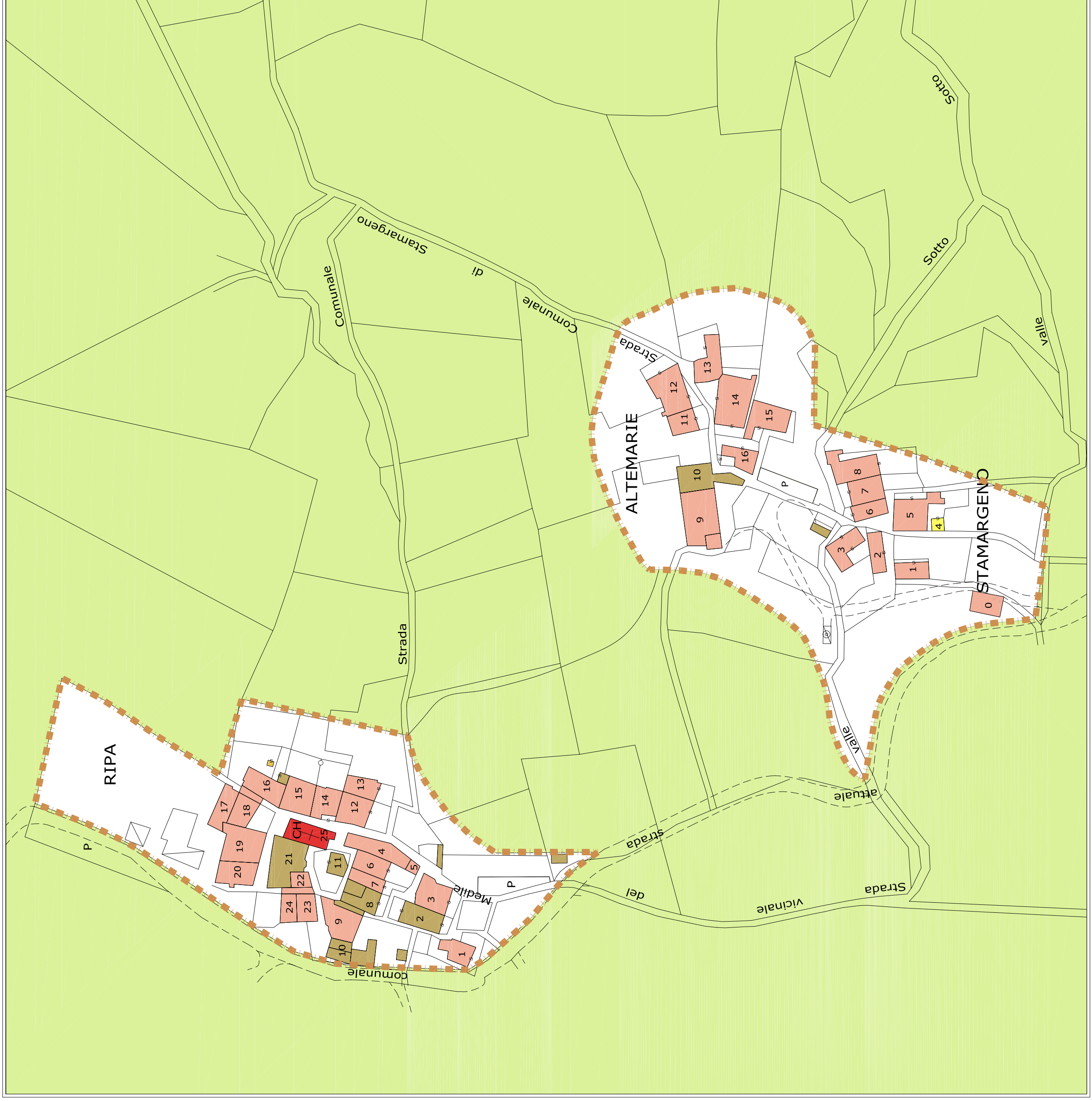
Planimetria ricavata dalla mappa catastale del 1954