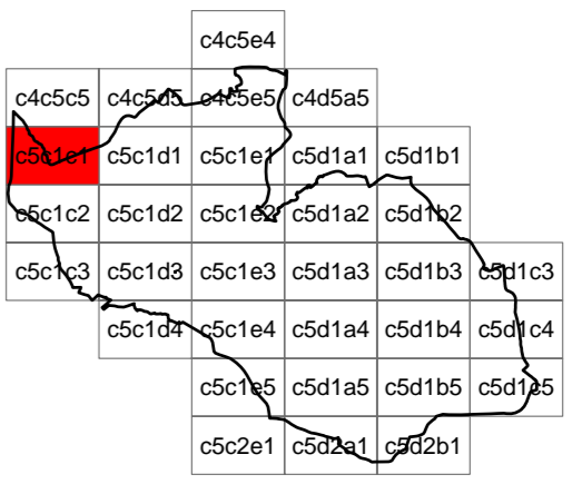
Foglio c5c1c1 - scala 1:2.000

coordinamento e progetto GIORGIO MANZONI ARCHITETTO MARIO MANZONI ARCHITETTO CAMILLA ROSSI ARCHITETTO TOMMASO METTIFOGO ARCHITETTO con MIRIAM PERSICO ARCHITETTO ALESSANDRA FROSIO INGEGNERE