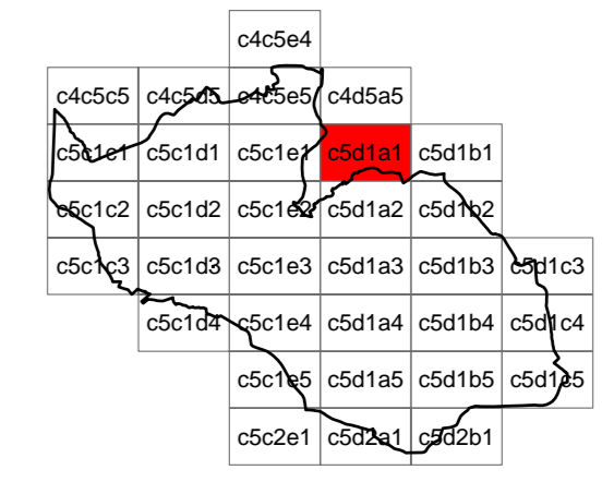
Foglio c5d1a1 - scala 1:2.000

coordinamento e progetto GIORGIO MANZONI ARCHITETTO MARIO MANZONI ARCHITETTO CAMILLA ROSSI ARCHITETTO TOMMASO METTIFOGO ARCHITETTO con MIRIAM PERSICO ARCHITETTO ALESSANDRA FROSIO INGEGNERE