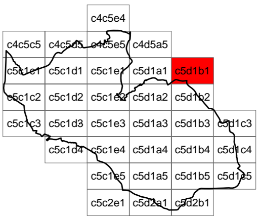
Foglio c5d1b1 - scala 1:2.000

coordinamento e progetto GIORGIO MANZONI ARCHITETTO MARIO MANZONI ARCHITETTO CAMILLA ROSSI ARCHITETTO TOMMASO METTIFOGO ARCHITETTO con MIRIAM PERSICO ARCHITETTO ALESSANDRA FROSIO INGEGNERE