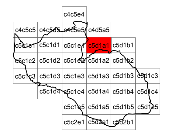
Foglio c5d1a1 - scala 1:2.000

coordinamento e progetto GIORGIO MANZONI ARCHITETTO MARIO MANZONI ARCHITETTO CAMILLA ROSSI ARCHITETTO TOMMASO METTIFOGO ARCHITETTO con MIRIAM PERSICO ARCHITETTO ALESSANDRA FROSIO INGEGNERE coordinamento e progetto ANGELA POLETTI PROF. INGEGNERE GIOVANNI CUCINI ARCHITETTO GIANLUCA DELLA MEA ARCHITETTO ANTONIO VISCOMI PIANIFICATORE TERRITORIALE