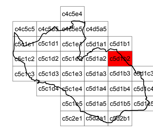
Foglio c5d1b2 - scala 1:2.000

coordinamento e progetto GIORGIO MANZONI ARCHITETTO MARIO MANZONI ARCHITETTO CAMILLA ROSSI ARCHITETTO TOMMASO METTIFOGO ARCHITETTO con MIRIAM PERSICO ARCHITETTO ALESSANDRA FROSIO INGEGNERE