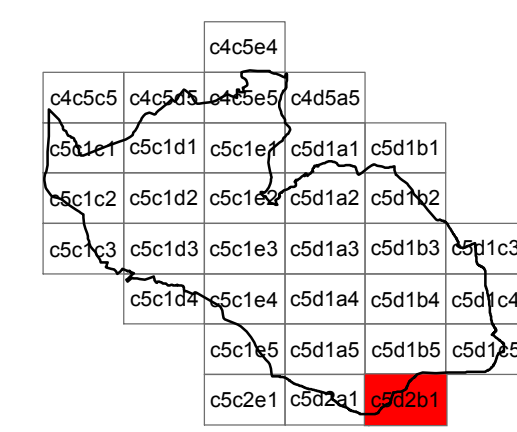
Foglio c5d2b1 - scala 1:2.000