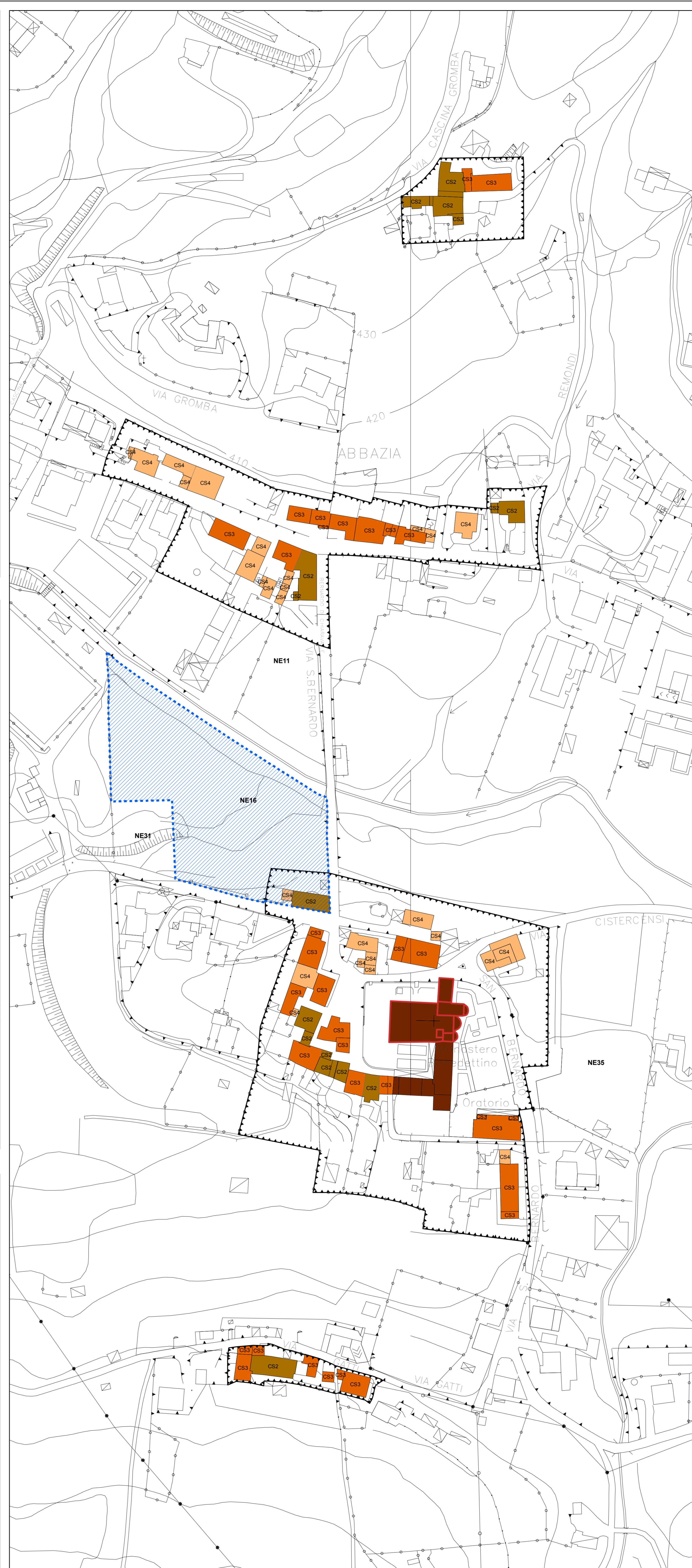
Remondi - Crocetta - Abbazia - Case Gatti