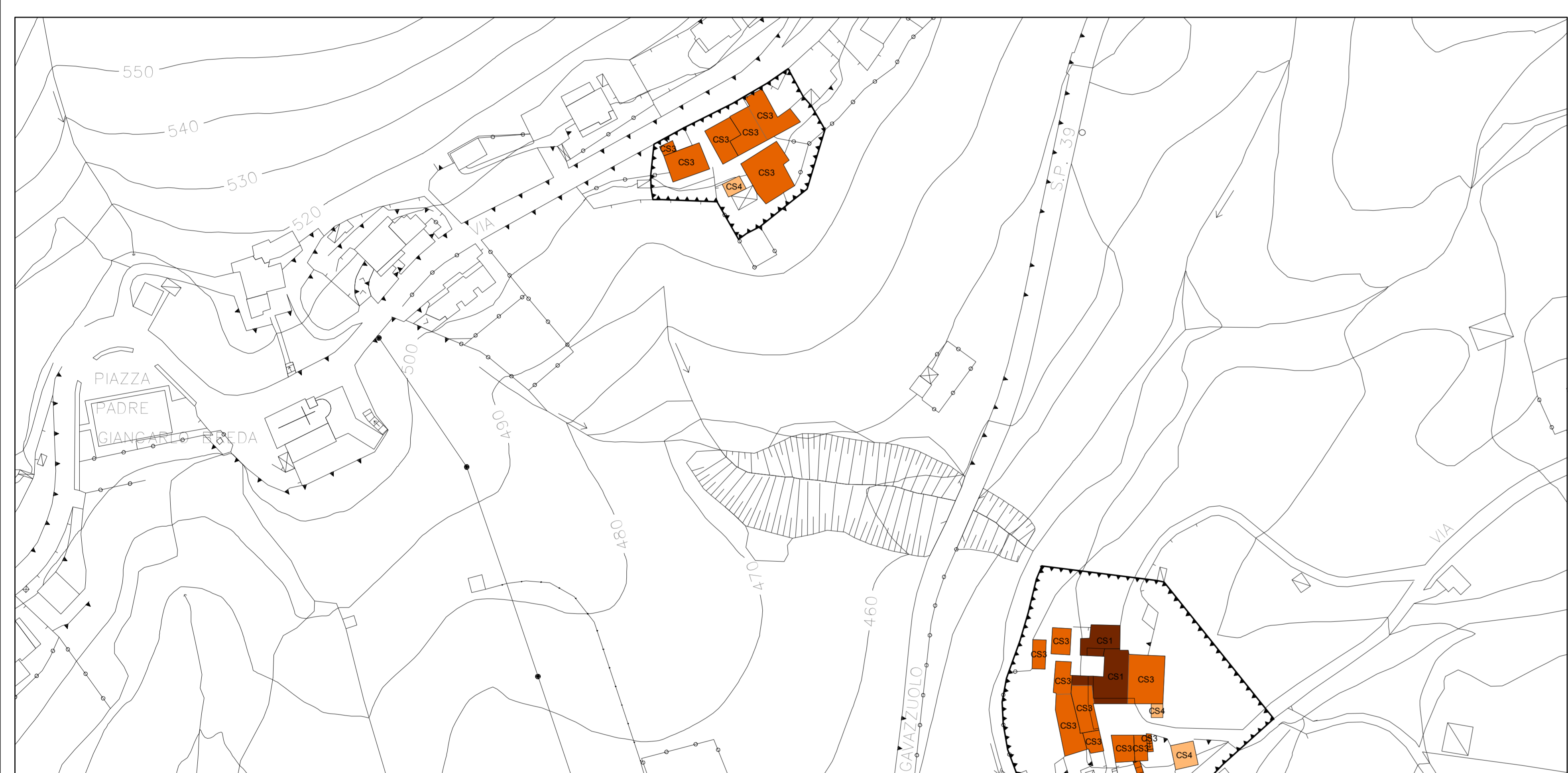
Sugallati - Chisolotti