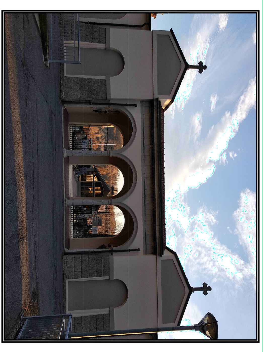
Tavola numero 7 B1

APPROVATO con Delibera C.C. N° ..... del ..... SCALA: 1:1500 DATA: giugno 2023 PLANIMETRIA STATO DI FATTO E INDIVIDUAZIONE TOMBE IN DEROGA