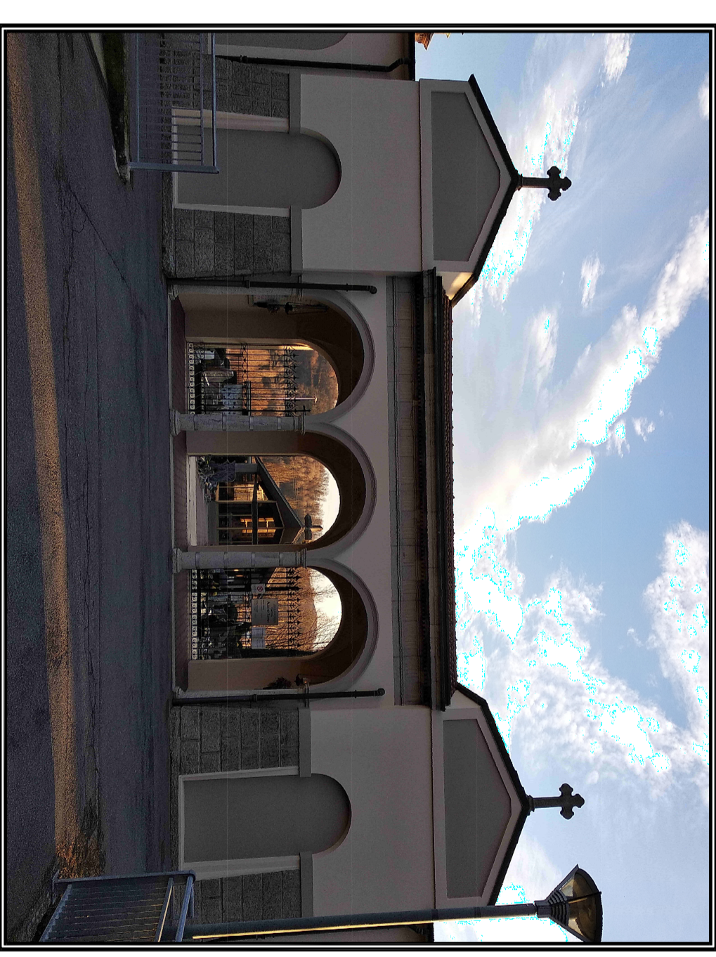
Tavola numero 7 B2 SCALA - varie DATA - Giugno 2020 APPROVATO con Delibera C.C. N° ... del ..... PROSPETTI LOCULI E OSSARI STATO DI FATTO E INDIVIDUAZIONI LOCULI IN DEROGA

Studio Tecnico PROGETTO AMBIENTE di Stefano Geom. Pierzanni Via A. Rovelli n°8 - 24027 Nembo BD Tel. 035-4127057 Fax: 035-4127549 E-mail: info@studiosudprogettiambiente.com Pec: stefano.pierzanni@geopcc.it Comune di Alzano Lombardo PIANO REGOLATORE CIMITERIALE (ai sensi art. 6 R.R. 9 Novembre 2004 n° 6) CIMITERO ALZANO SOPRA