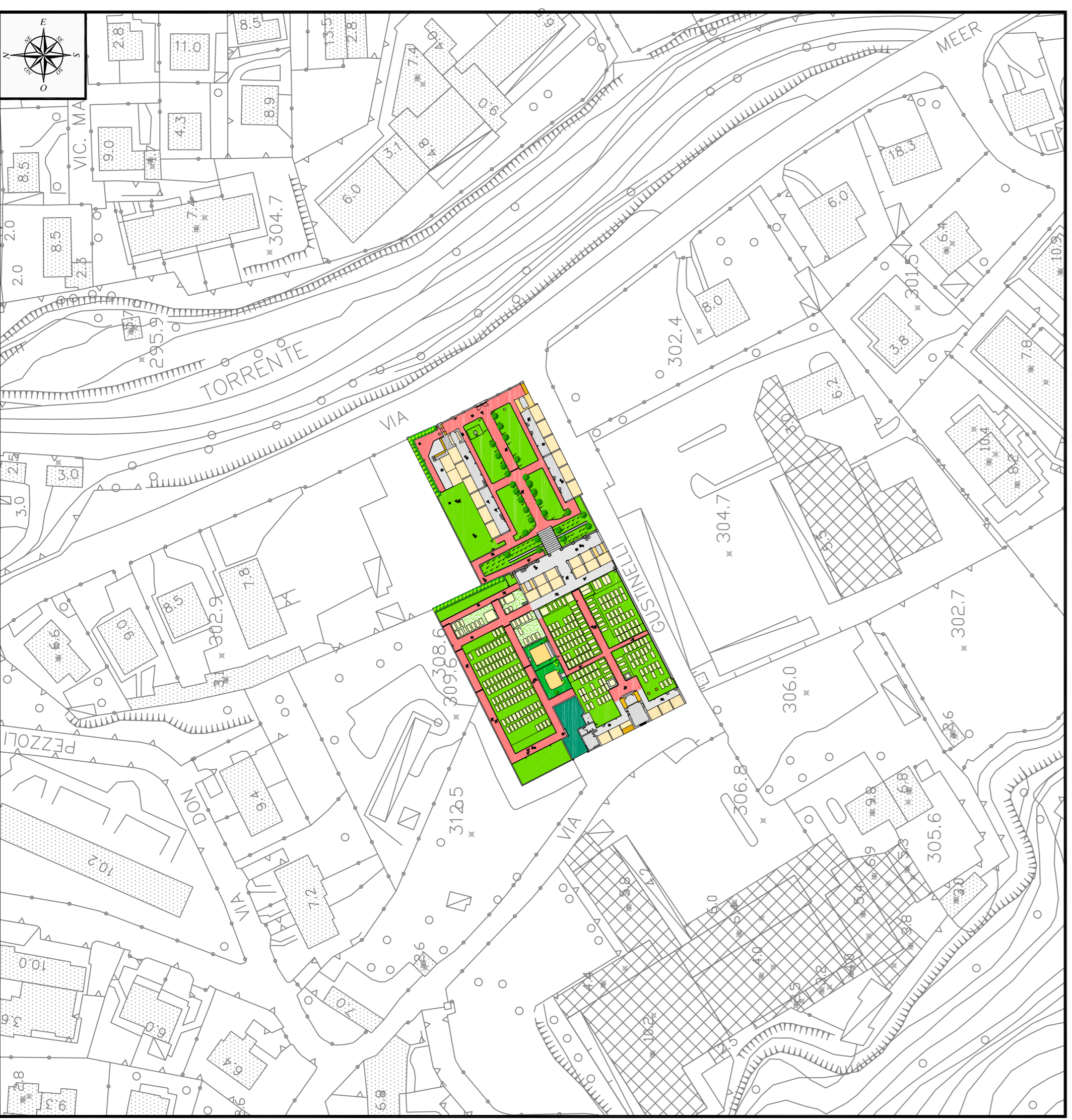
Inquadramento aerofotogrammetrico - scala 1:1.000

RILIEVO STATO DI FATTO E INQUADRAMENTO AEROFOTOGRAMMETRICO