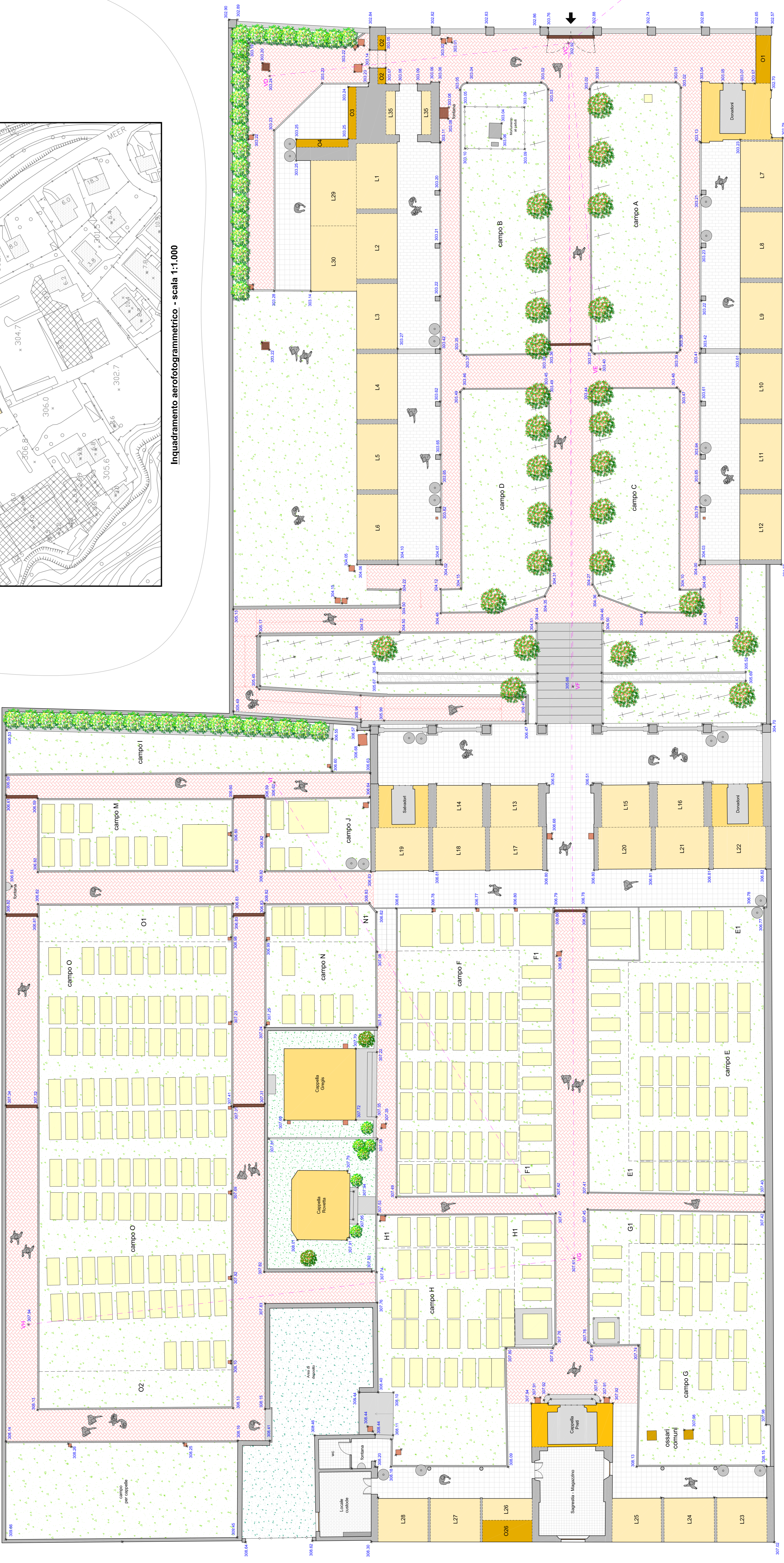
RILIEVO STATO DI FATTO scala 1:100