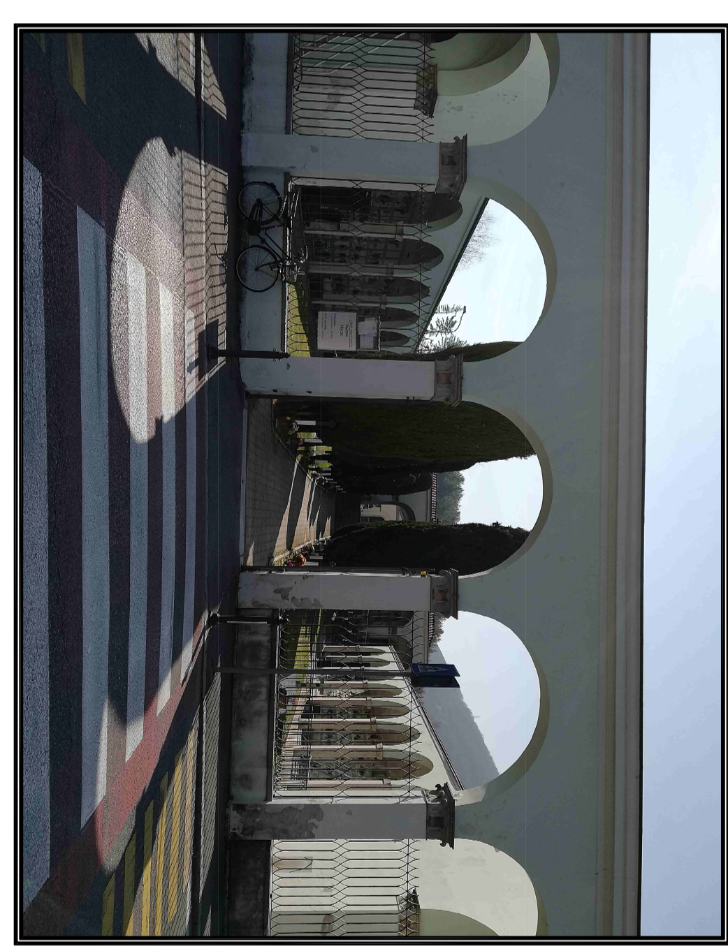
Tavola numero 6C2

PIANO REGOLATORE CIMITERIALE (ai sensi art. 6 R.R. 9 Novembre 2004 n° 6) CIMITERO NESE