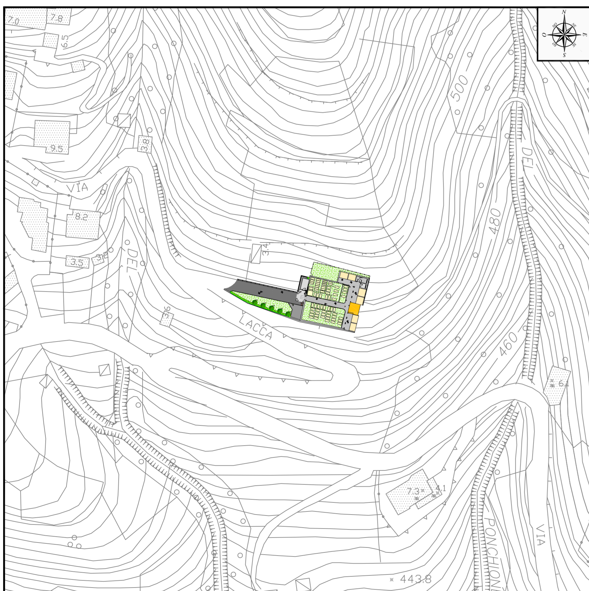
Inquadramento aerofotogrammetrico - scala 1:1.000