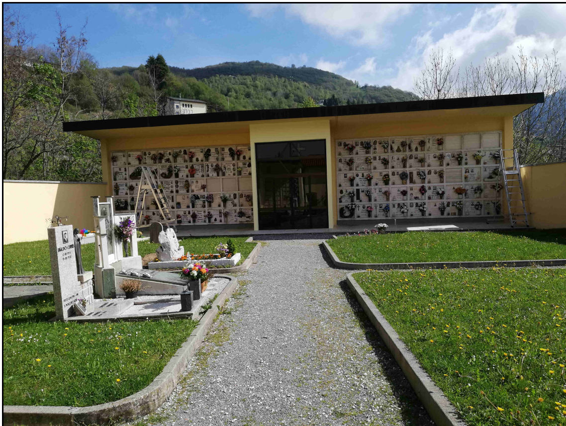
F. 05 – Vista Chiesetta e Loculi L1-L2