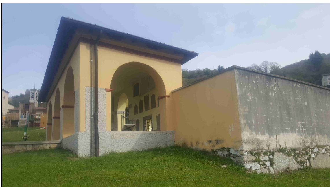
F. 04 – Vista Prospettica dell'Ingresso dall'esterno