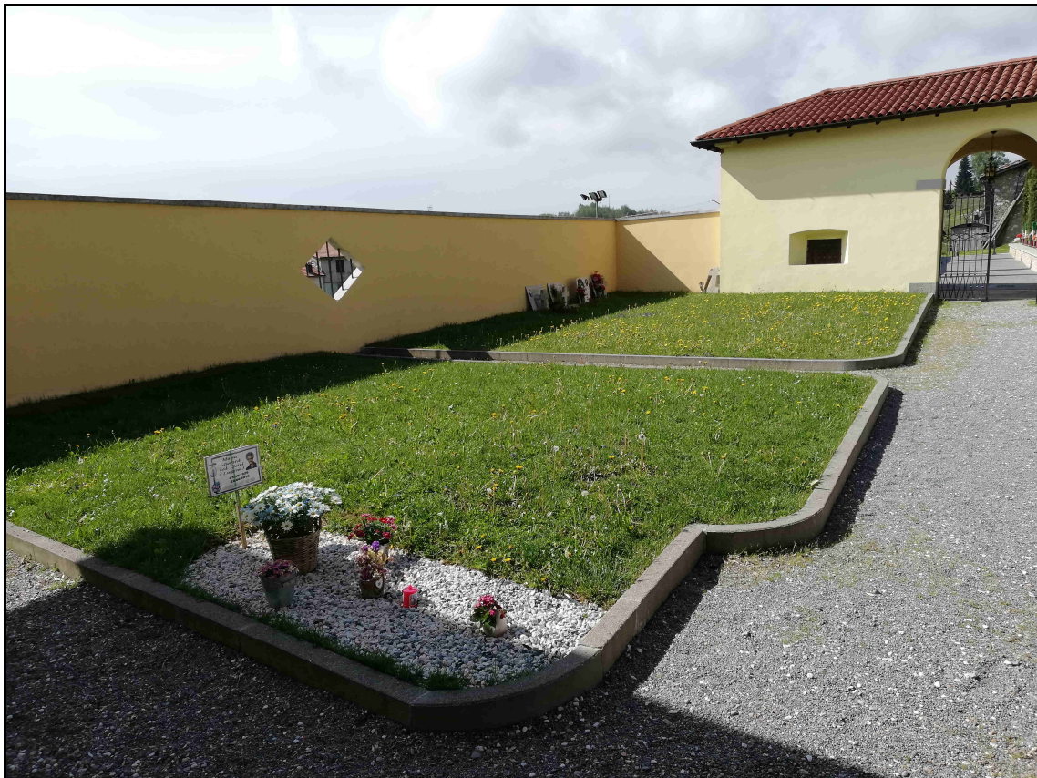
F. 06 – Vista Campi D e A