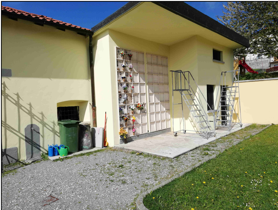
F. 09 – Vista Ossari (01) e Locale Attrezzi