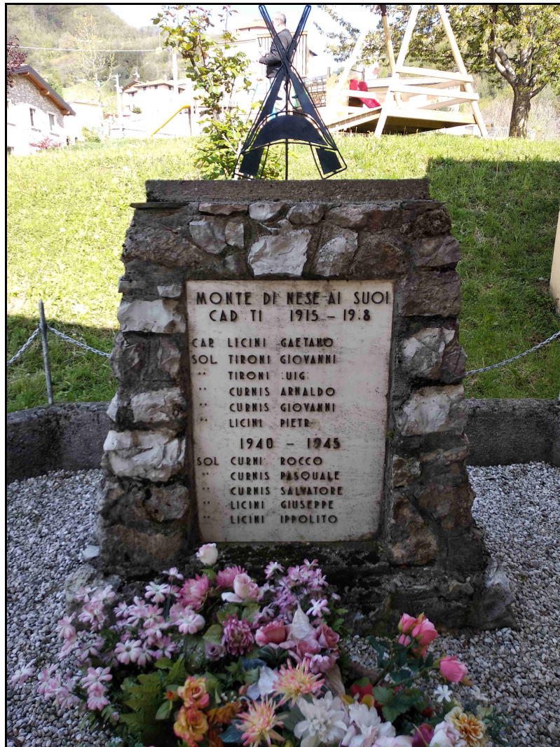
F. 03 – Vista Monumento ai Caduti