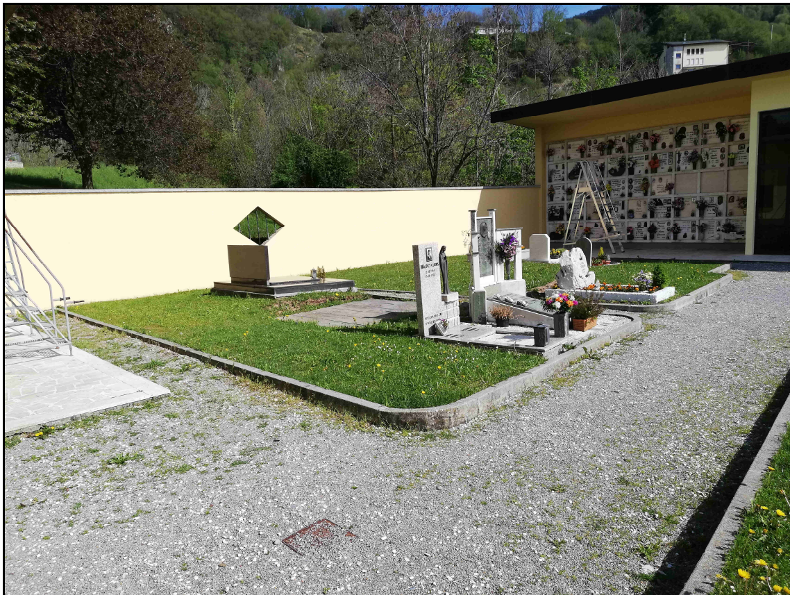
F.07 – Vista Campo B