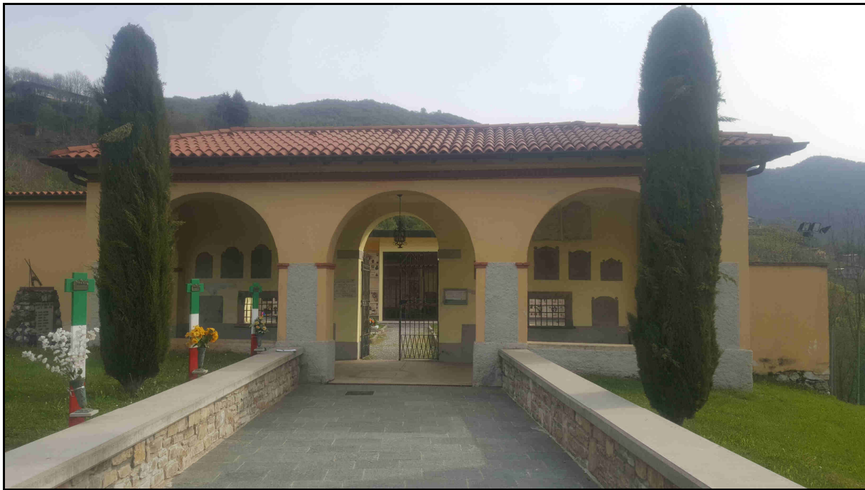
F. 01 – Vista Ingresso dall'esterno