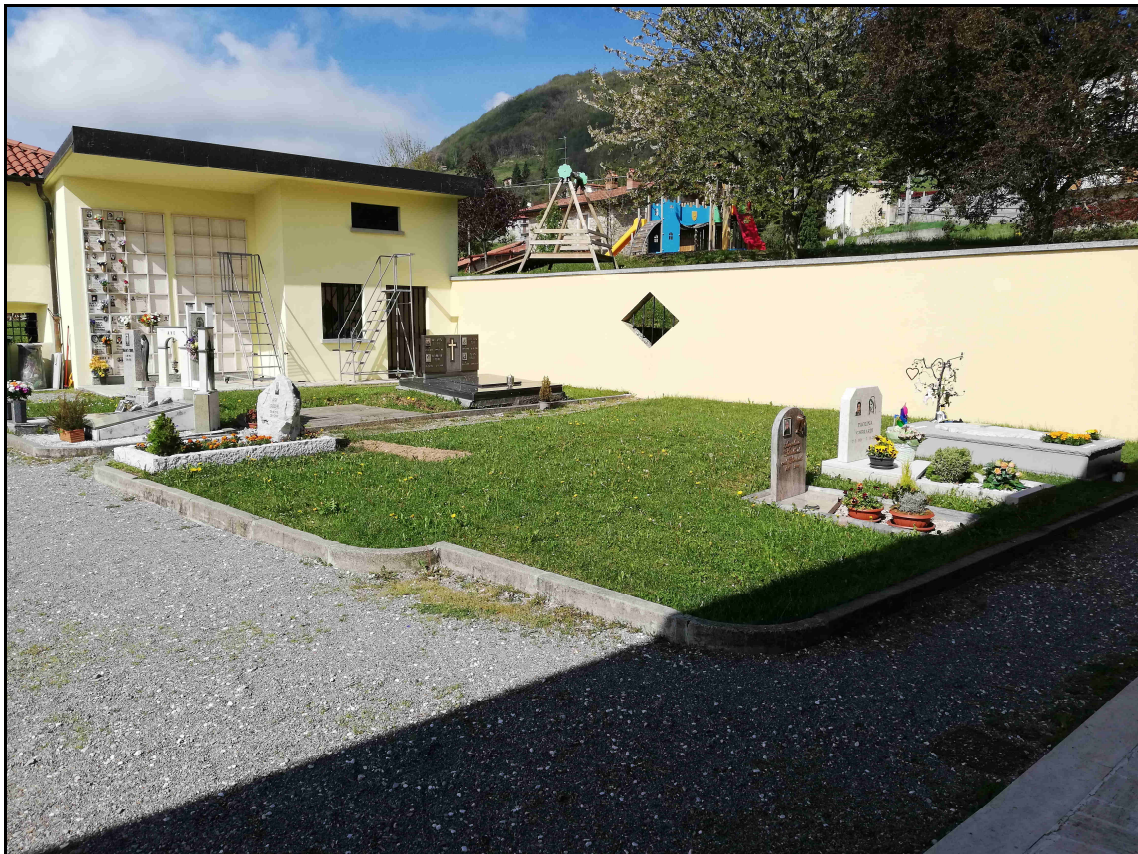
F.08 – Vista Campo C