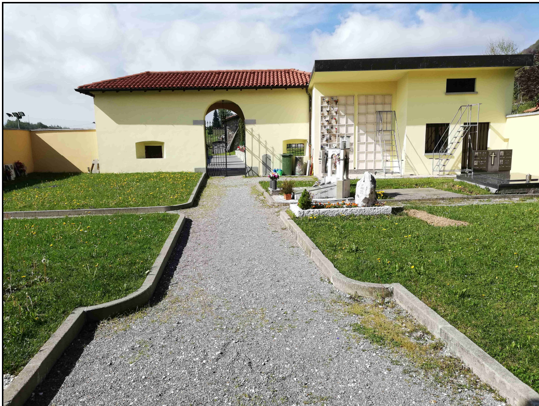
F. 10 – Vista Ingresso dall'interno