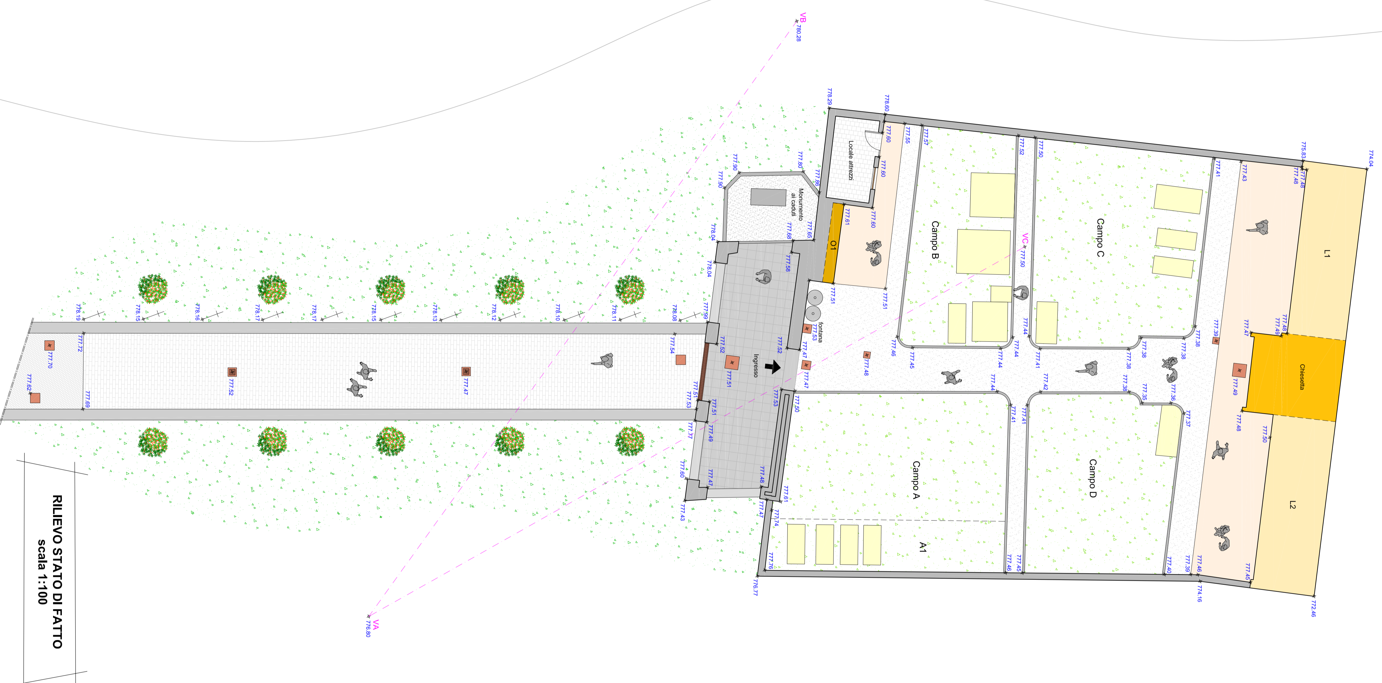
RILEVIO STATO DI FATTO scala 1:100