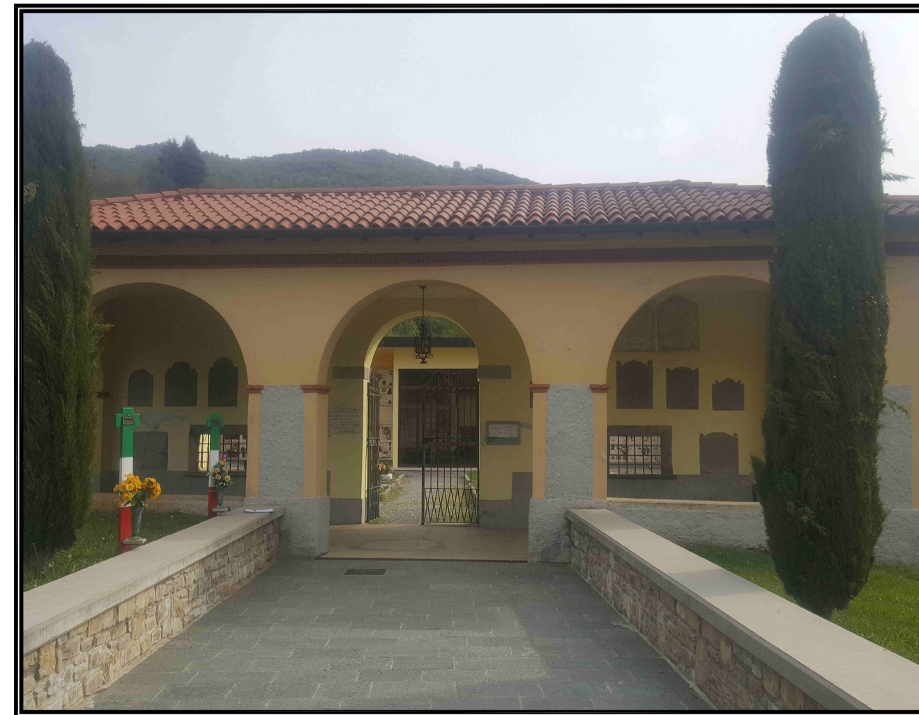
Tavola numero 7E