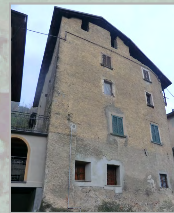
30 RISANAMENTO CONSERVATIVO (2)