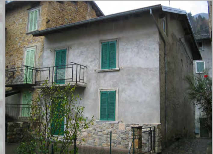
14 RISANAMENTO CONSERVATIVO (2)