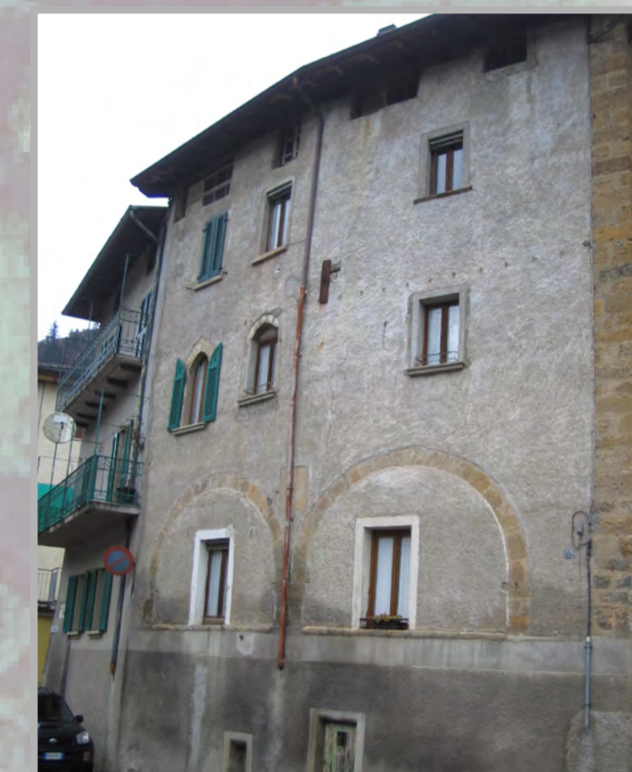
21 RISANAMENTO CONSERVATIVO (2)