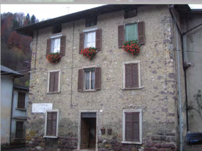
4 RISANAMENTO CONSERVATIVO (2)