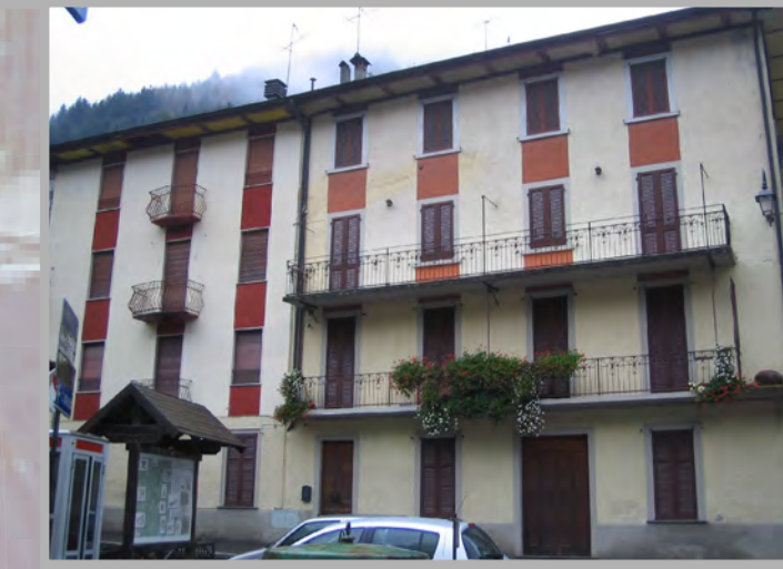
26 RESTAURO (1)