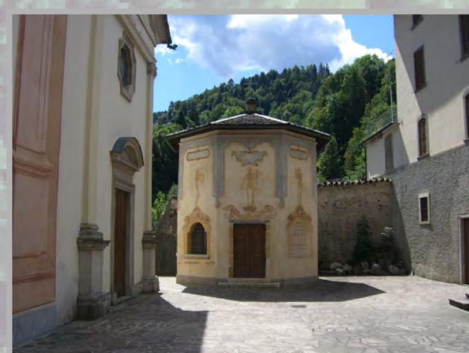
7 RESTAURO (1)