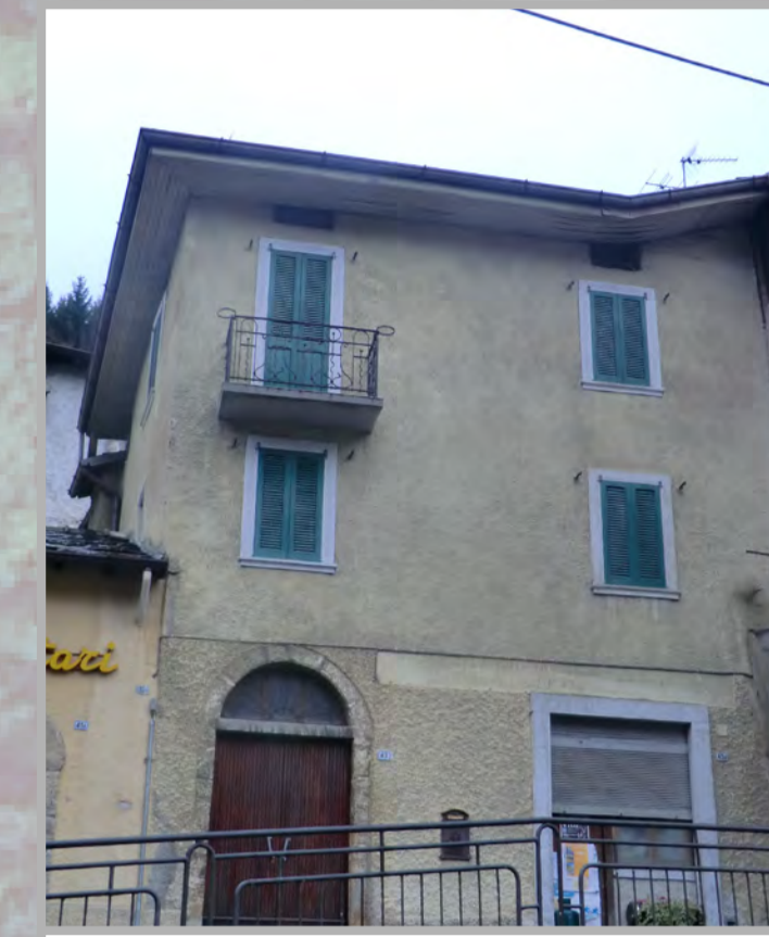
20 RISANAMENTO CONSERVATIVO (2)