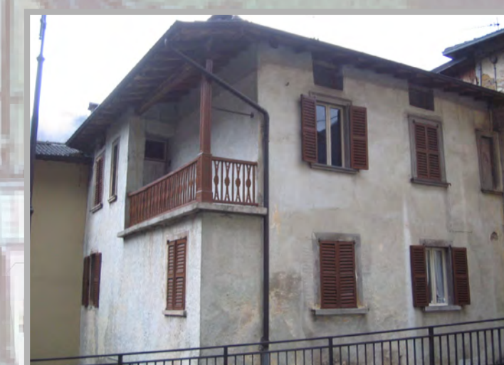
11 RISANAMENTO CONSERVATIVO (2)