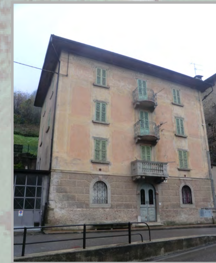
29 RISANAMENTO CONSERVATIVO (2)