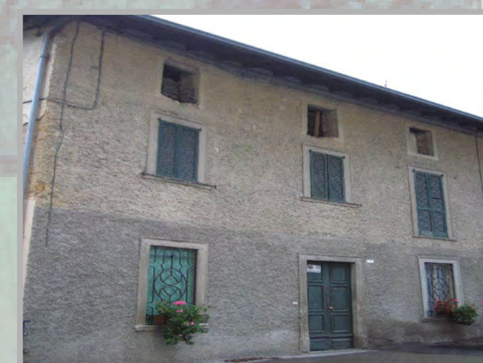
10 RISANAMENTO CONSERVATIVO (2)