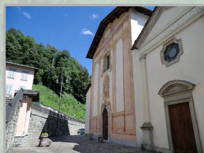
8 RESTAURO (1)