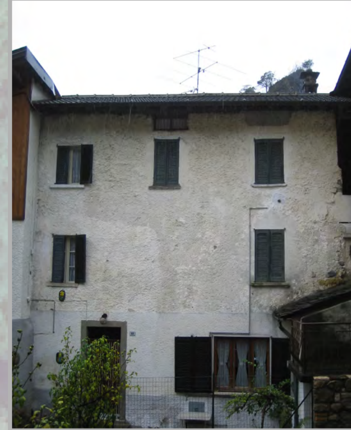
15 RISANAMENTO CONSERVATIVO (2)