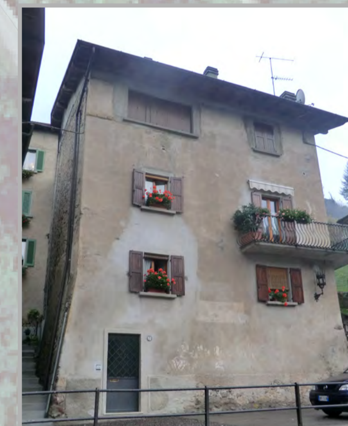
28 RISANAMENTO CONSERVATIVO (2)