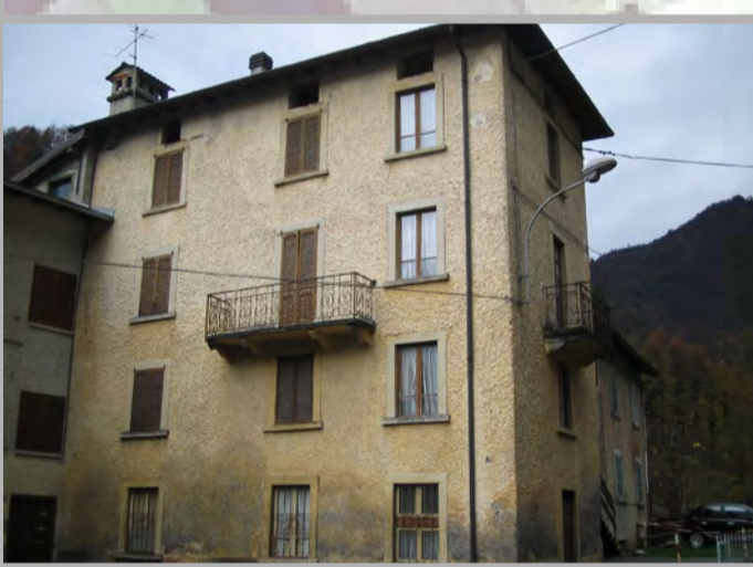
3 RISANAMENTO CONSERVATIVO (2)