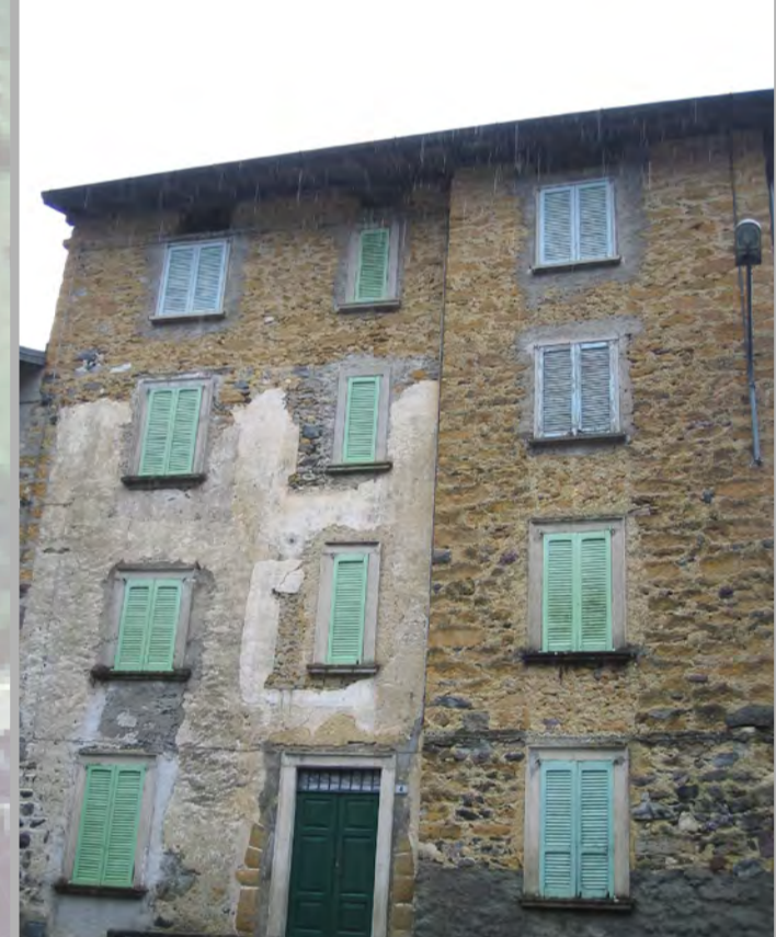
13 RISANAMENTO CONSERVATIVO (2)