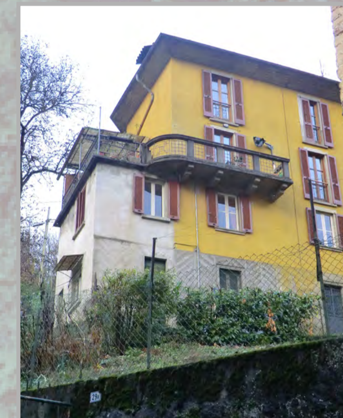
23 RISANAMENTO CONSERVATIVO (2)