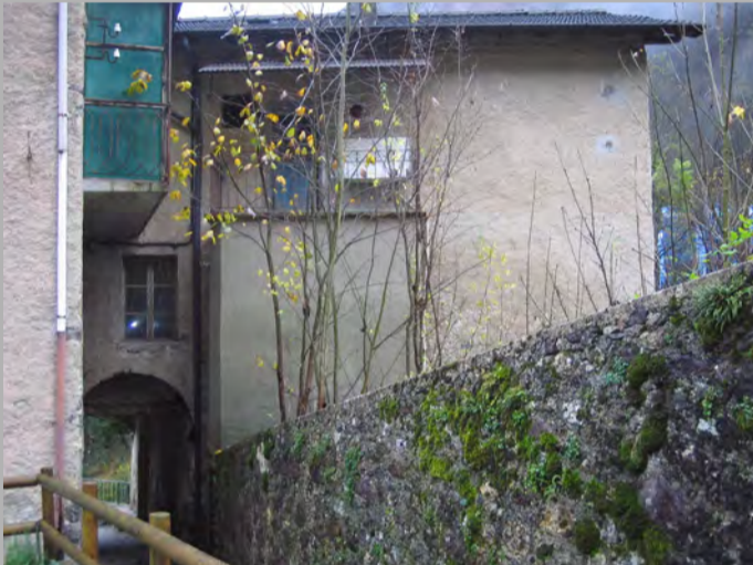
1 RISANAMENTO CONSERVATIVO (2)