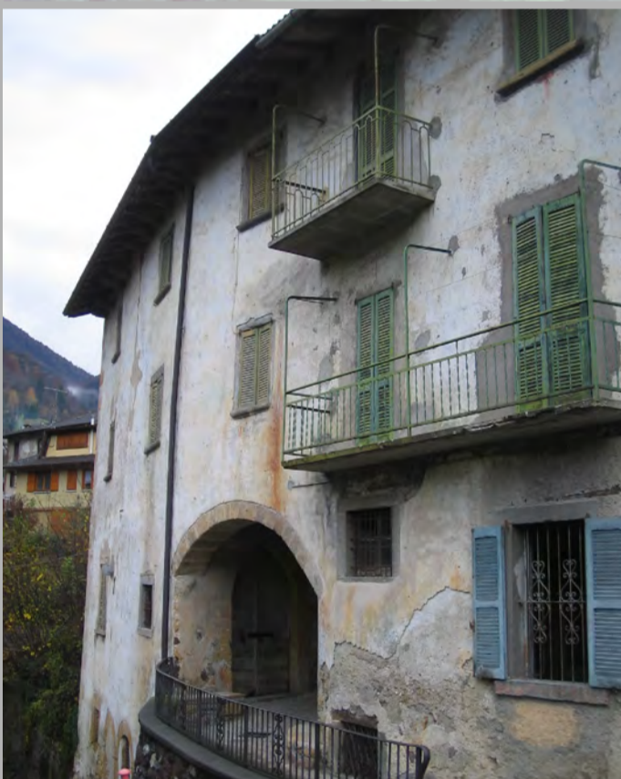
2 RISANAMENTO CONSERVATIVO (2)