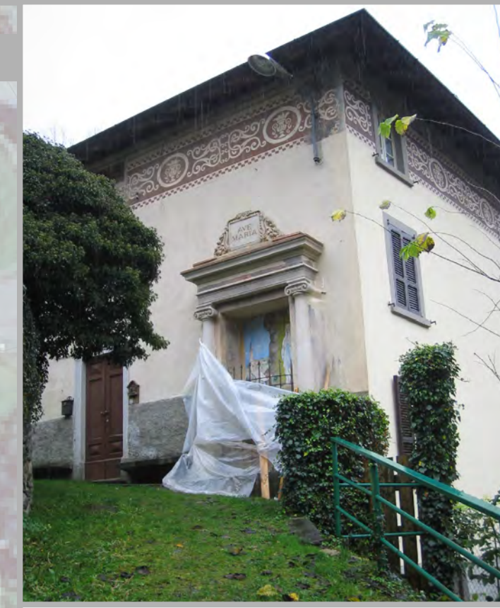
18 RESTAURO (1)