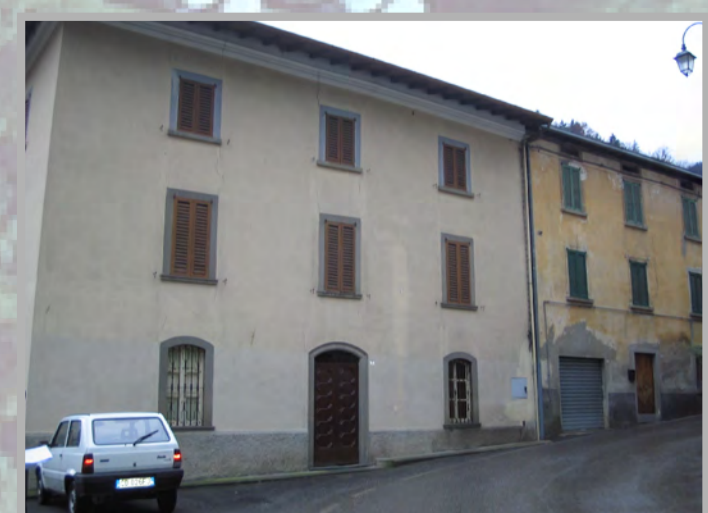
6 RISANAMENTO CONSERVATIVO (2)