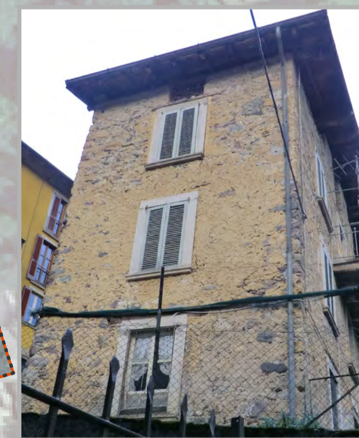
24 RISANAMENTO CONSERVATIVO (2)