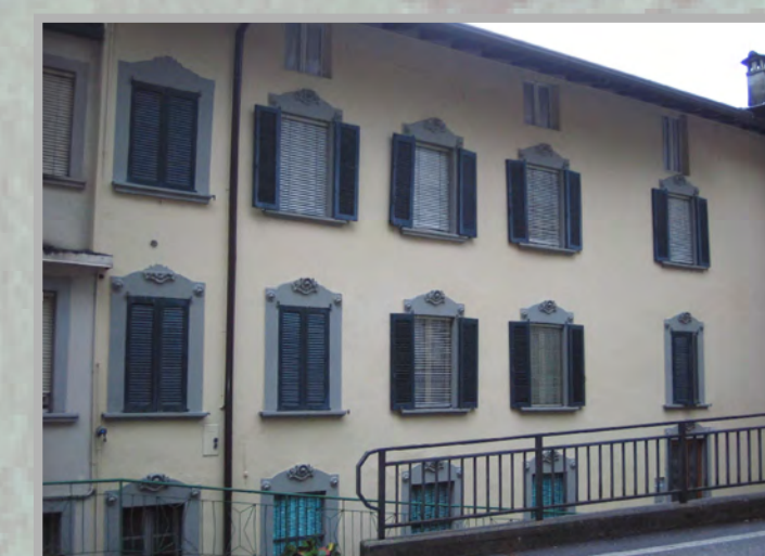
12 RISANAMENTO CONSERVATIVO (2)