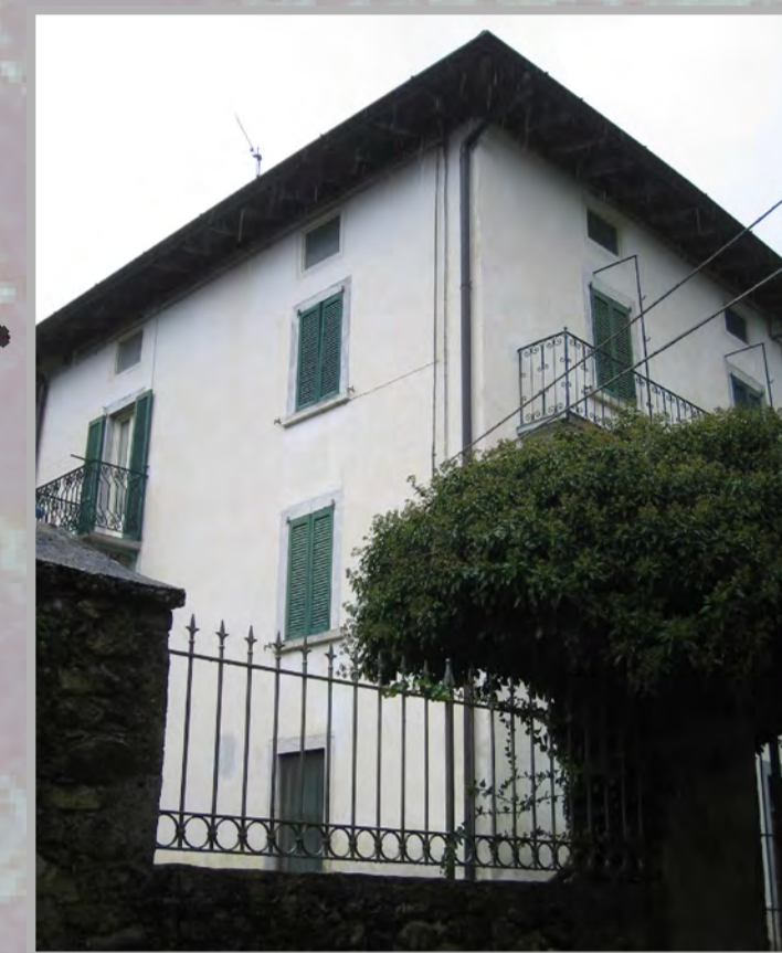
17 RISANAMENTO CONSERVATIVO (2)