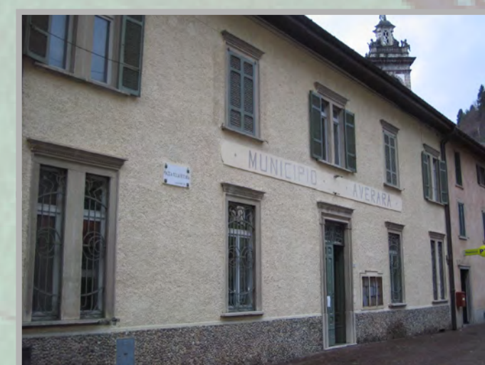
9 RESTAURO (1)