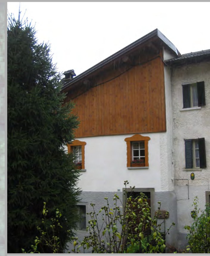
16 RISTRUTTURAZIONE EDILIZIA (4)