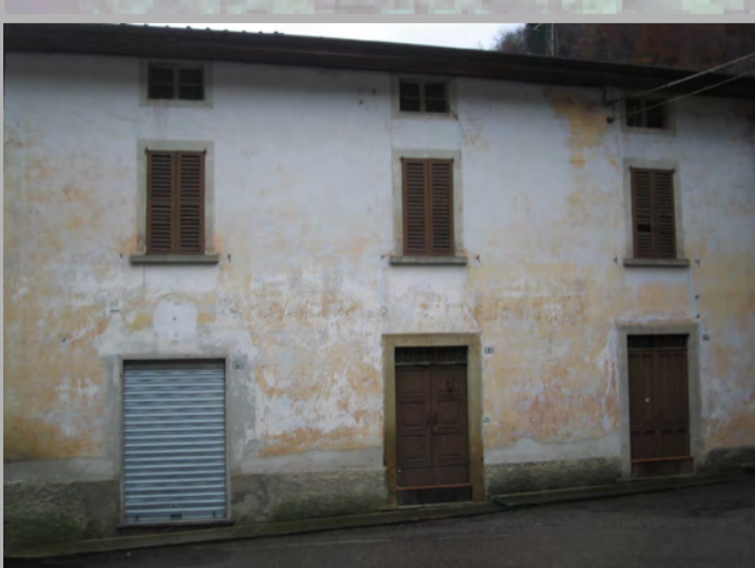
5 RISANAMENTO CONSERVATIVO (2)