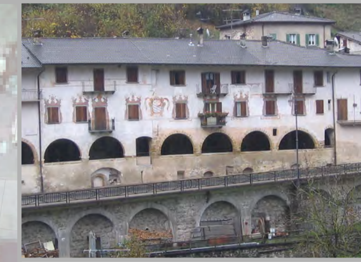
25 RESTAURO (1)