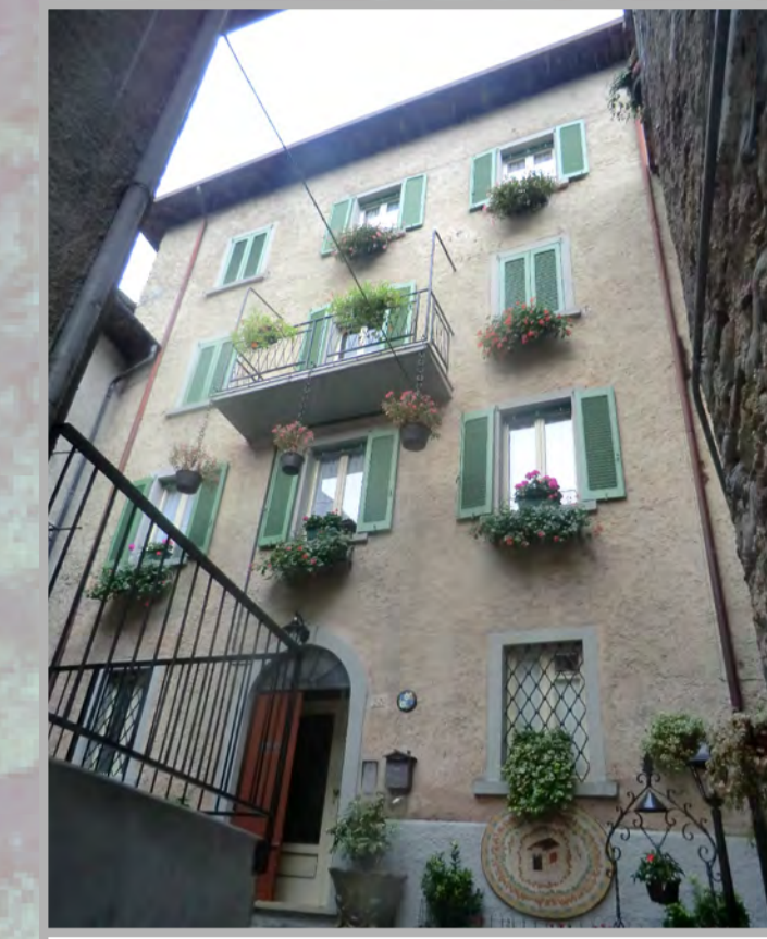
27 RISANAMENTO CONSERVATIVO (2)