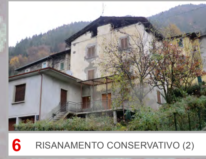
6 RISANAMENTO CONSERVATIVO (2)