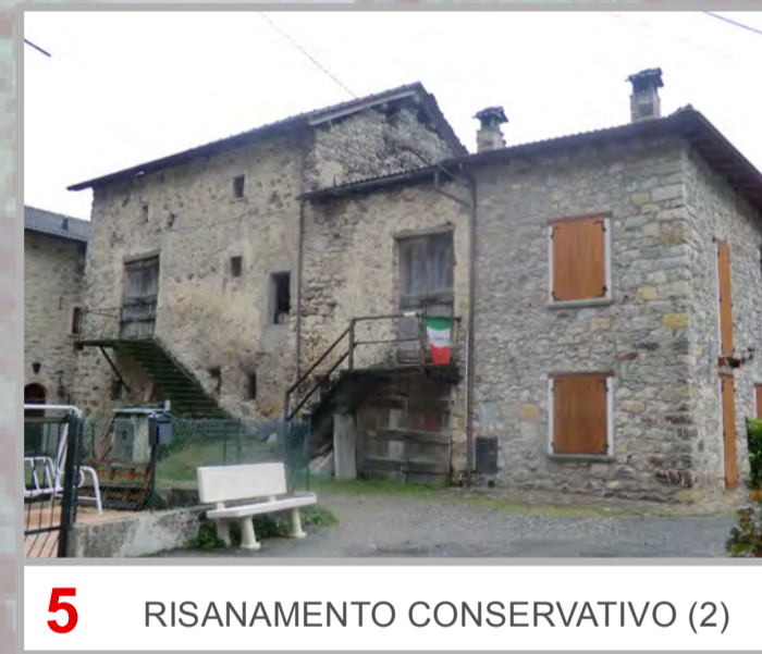
5 RISANAMENTO CONSERVATIVO (2)