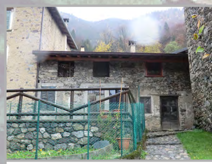
2 RISANAMENTO CONSERVATIVO (2)