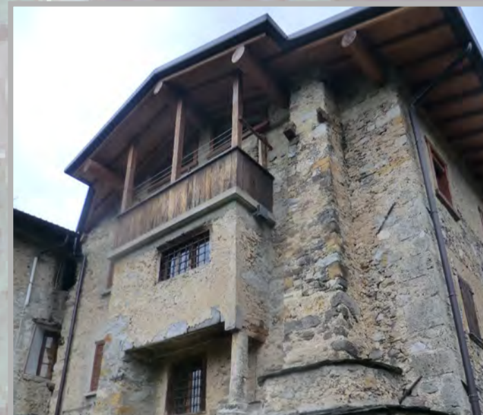
3 RISANAMENTO CONSERVATIVO (2)