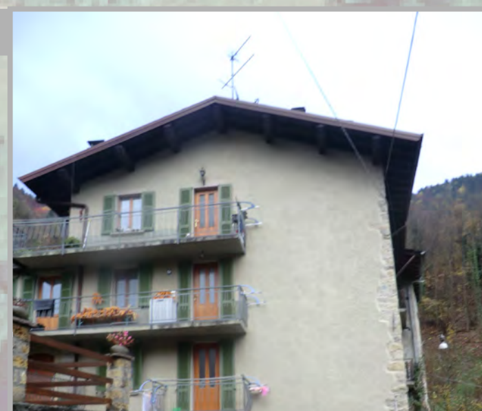
6 RISANAMENTO CONSERVATIVO (2)