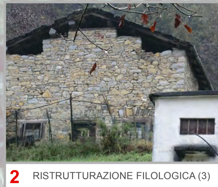
2 RISTRUTTURAZIONE FILOLOGICA (3)