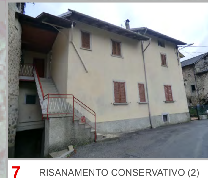
7 RISANAMENTO CONSERVATIVO (2)