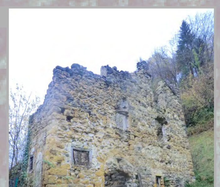
1 RISTRUTTURAZIONE FILOLOGICA (3)