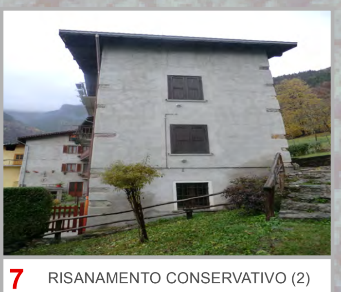
7 RISANAMENTO CONSERVATIVO (2)