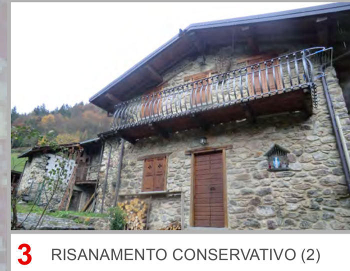
3 RISANAMENTO CONSERVATIVO (2)