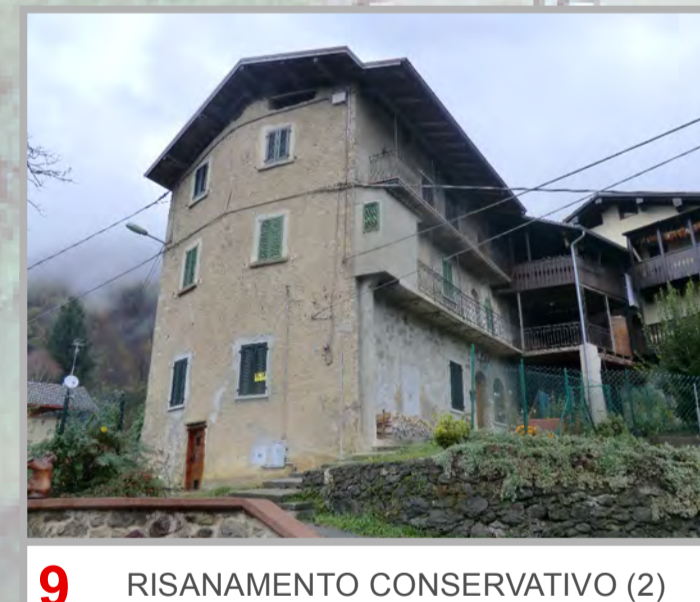
9 RISANAMENTO CONSERVATIVO (2)