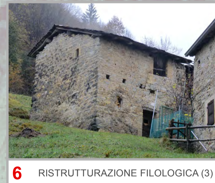
6 RISTRUTTURAZIONE FILOLOGICA (3)