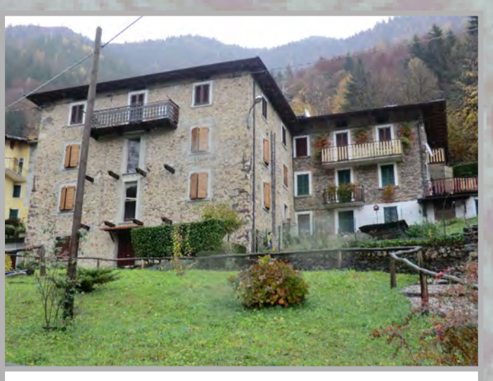
8 RISANAMENTO CONSERVATIVO (2)