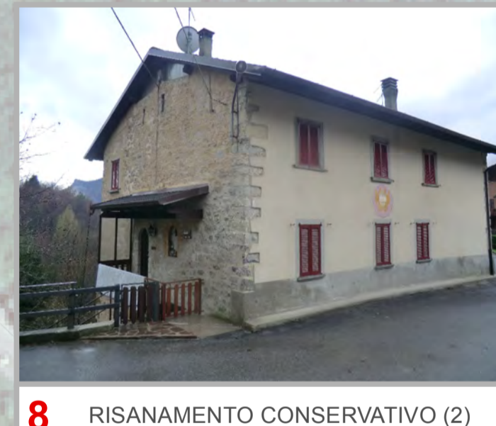
8 RISANAMENTO CONSERVATIVO (2)