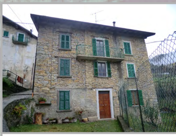
3 RISANAMENTO CONSERVATIVO (2)