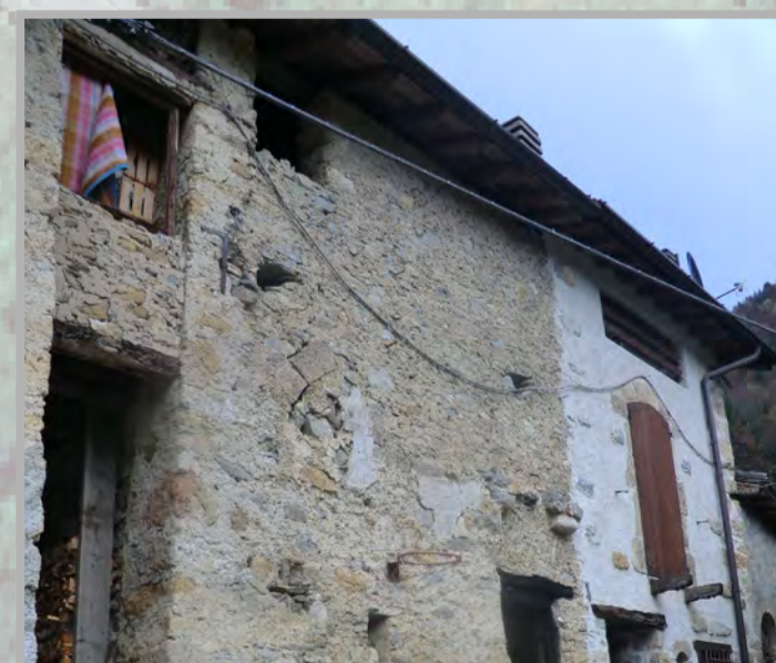
3 RISANAMENTO CONSERVATIVO (2)