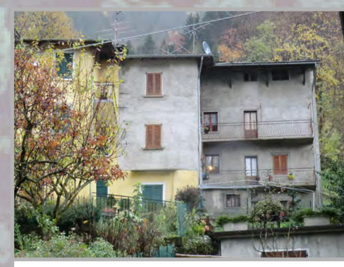
5 RISANAMENTO CONSERVATIVO (2)