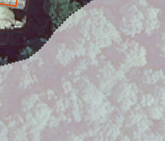
7 RESTAURO (1)