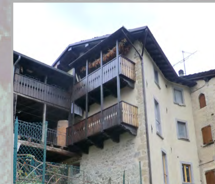
10 RISANAMENTO CONSERVATIVO (2)