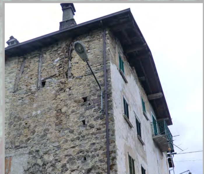
4 RISANAMENTO CONSERVATIVO (2)