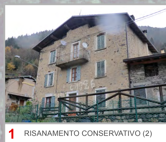
1 RISANAMENTO CONSERVATIVO (2)