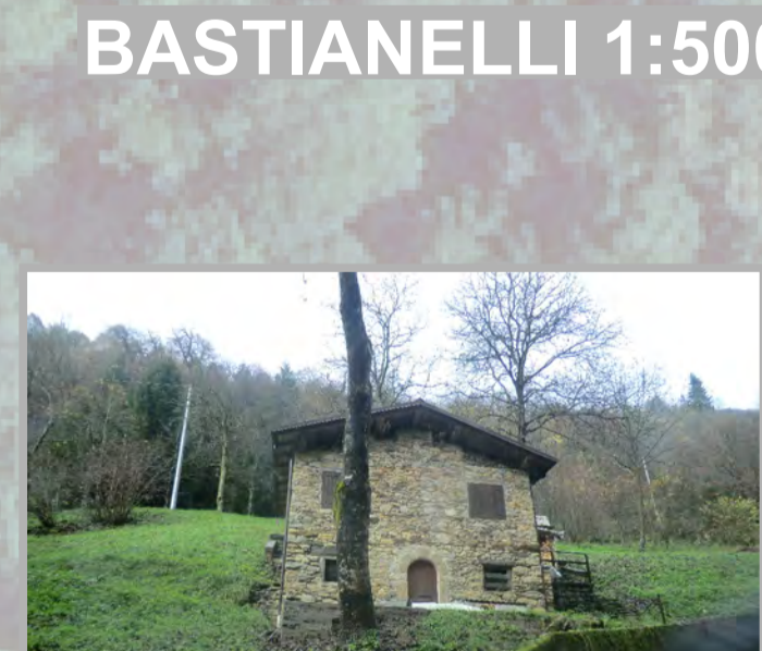
3 RISTRUTTURAZIONE FILOLOGICA (3)