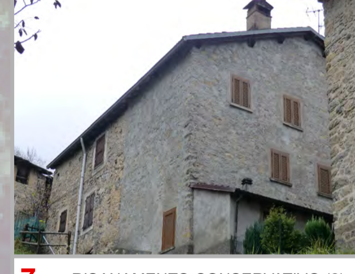
7 RISANAMENTO CONSERVATIVO (2)