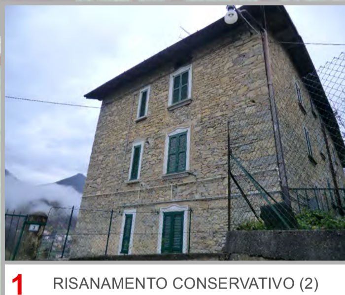
1 RISANAMENTO CONSERVATIVO (2)