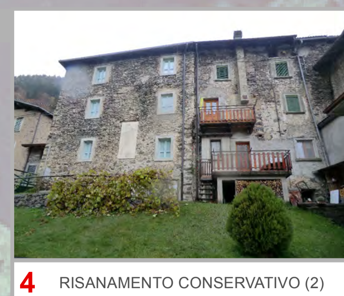
4 RISANAMENTO CONSERVATIVO (2)