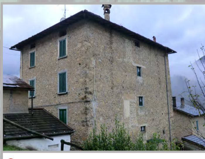
2 RISANAMENTO CONSERVATIVO (2)