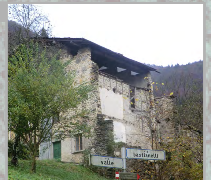
1,2 RISTRUTTURAZIONE FILOLOGICA (3)