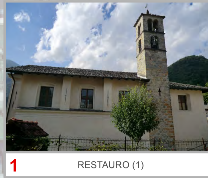
1 RESTAURO (1)