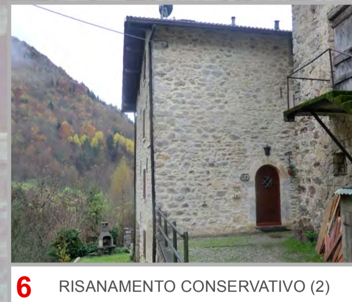
6 RISANAMENTO CONSERVATIVO (2)