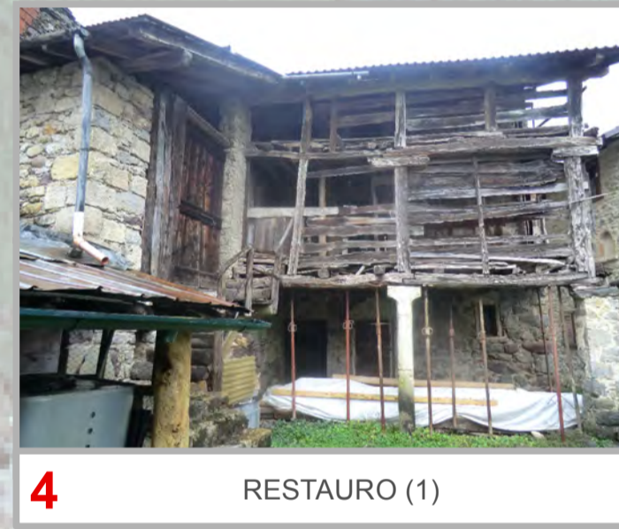
4 RESTAURO (1)