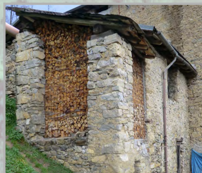
1 RISTRUTTURAZIONE FILOLOGICA (3)