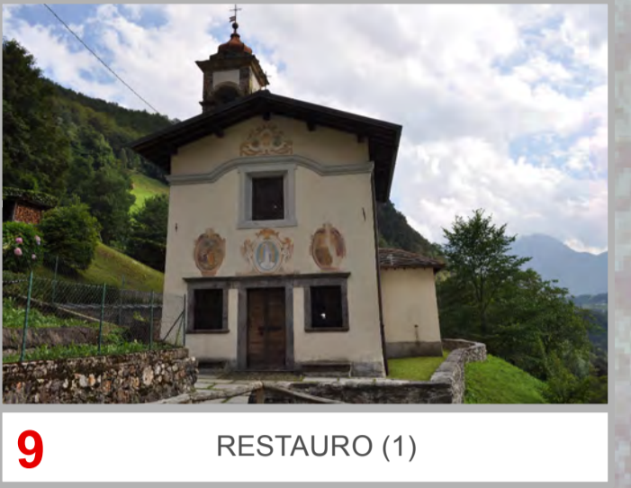
9 RESTAURO (1)