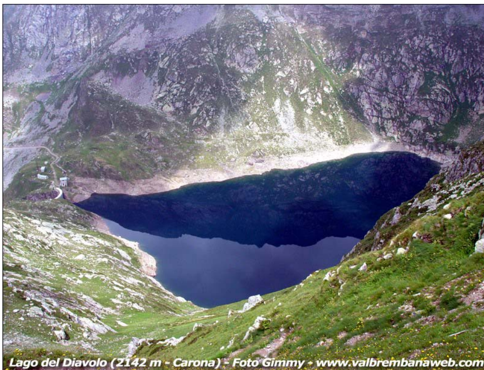
Lago del Diavolo (2142 m - Carona)