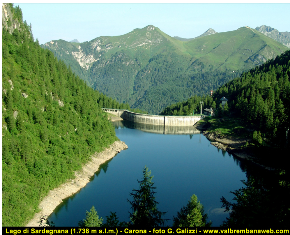
Fotografia n. 28