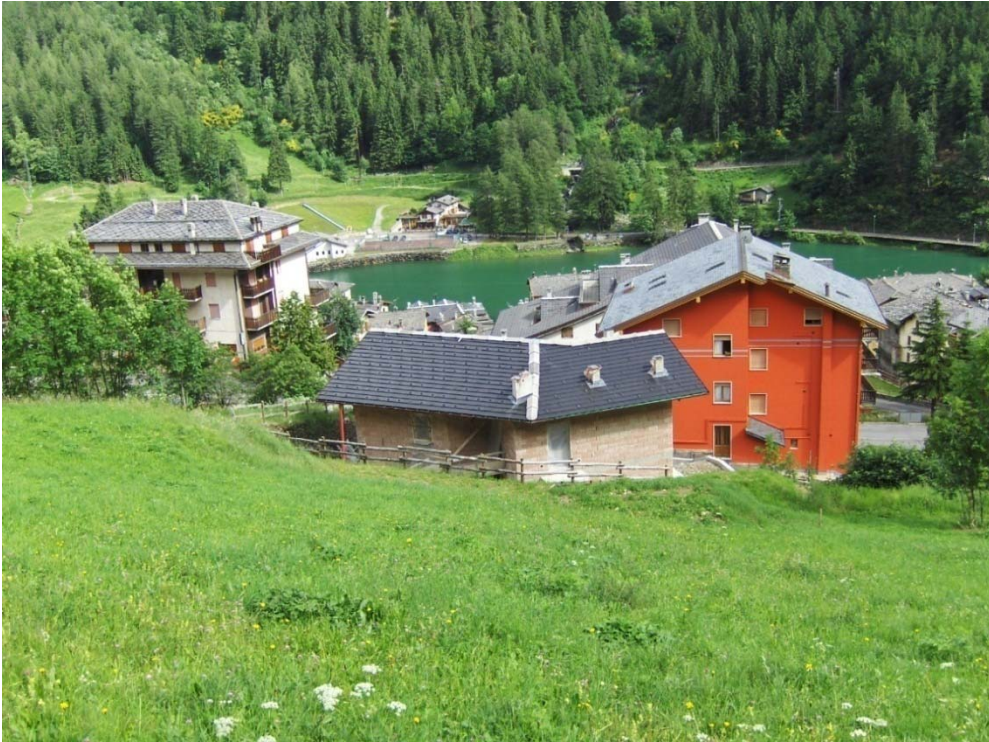
Fotografia n. 7