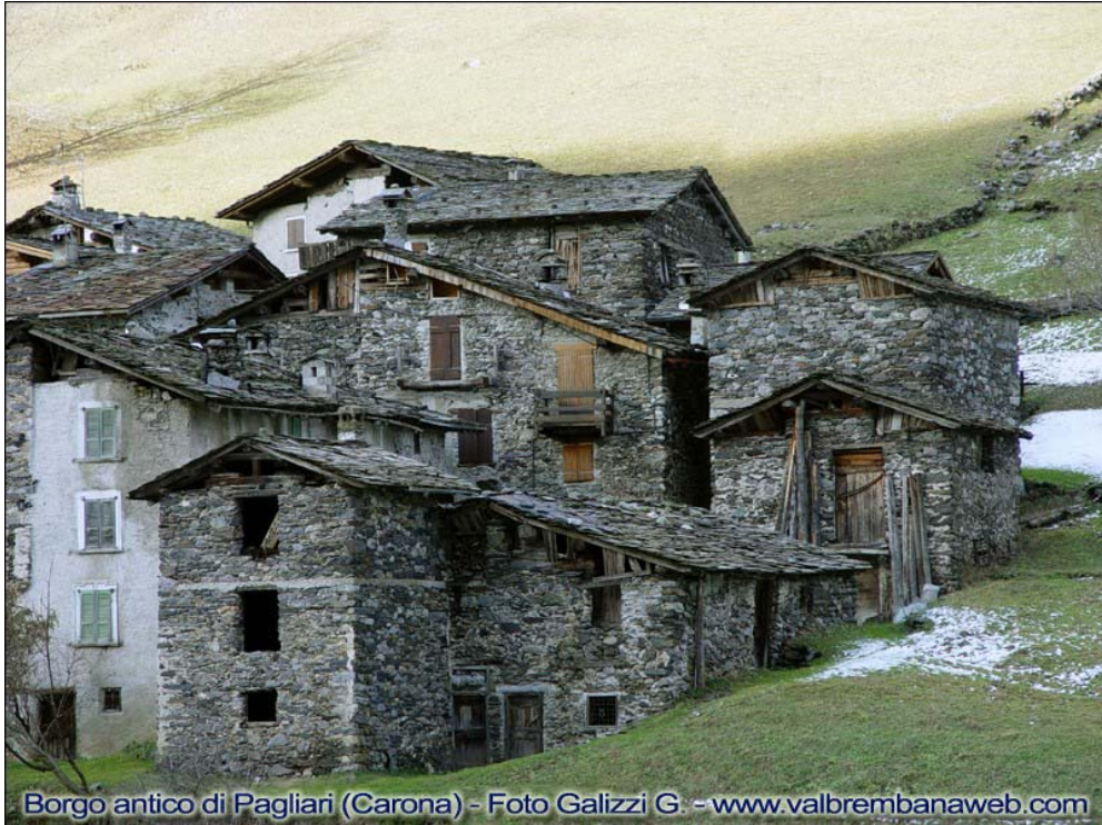
Fotografia n. 11