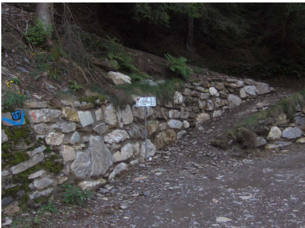
Fotografia n. 17