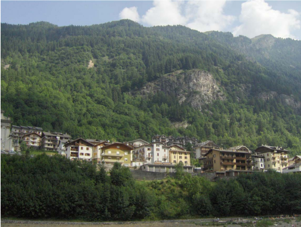
Fotografia n. 5