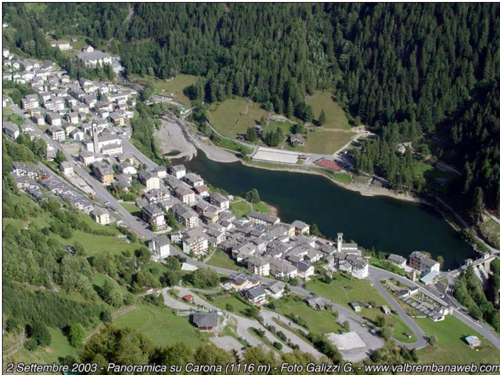
Fotografia n. 1