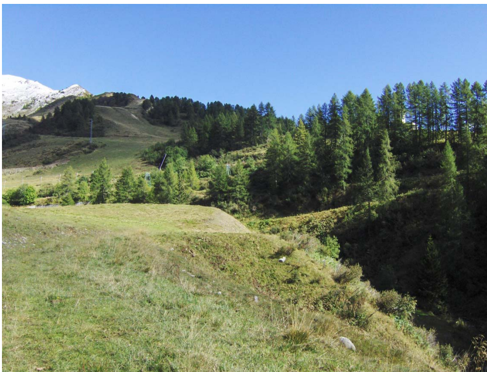
Fotografia n. 19