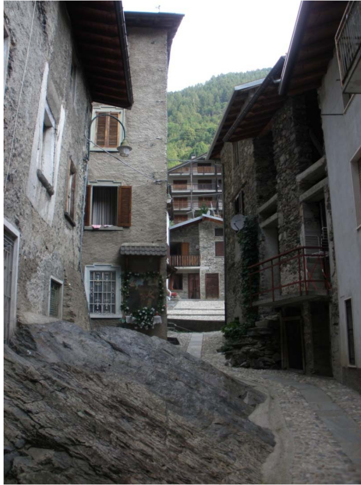
Fotografia n. 9