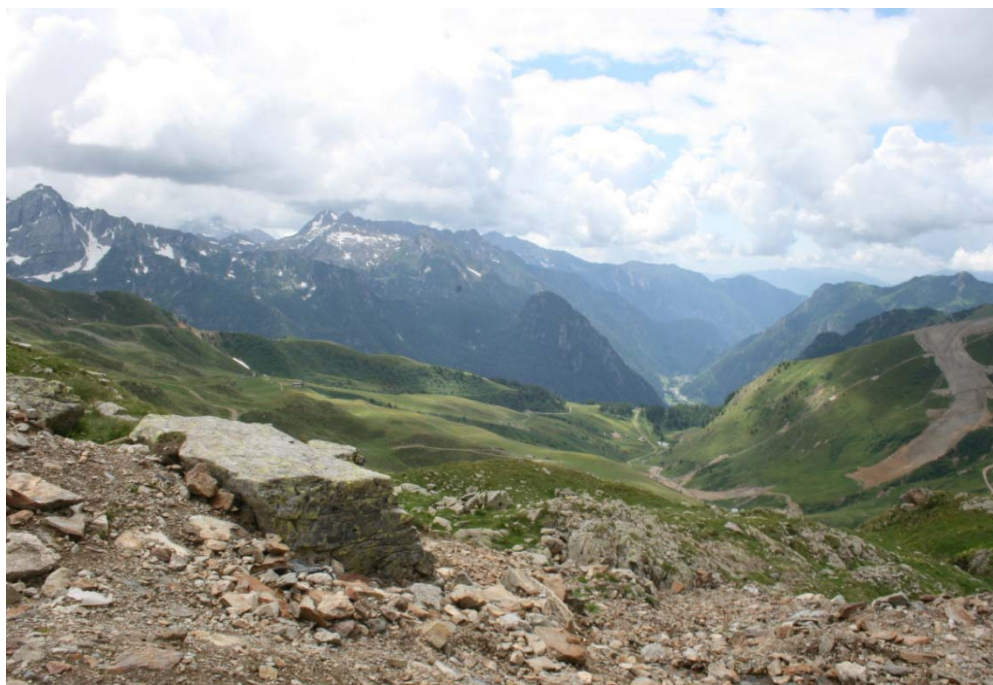
Fotografia n. 20