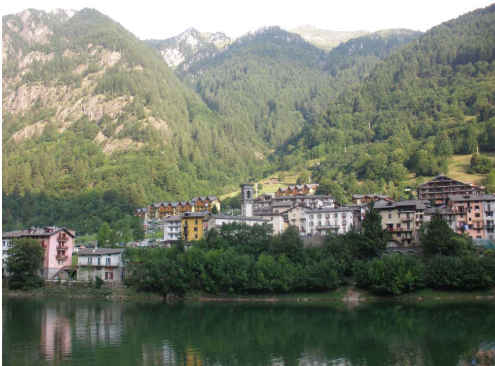
Fotografia n. 6