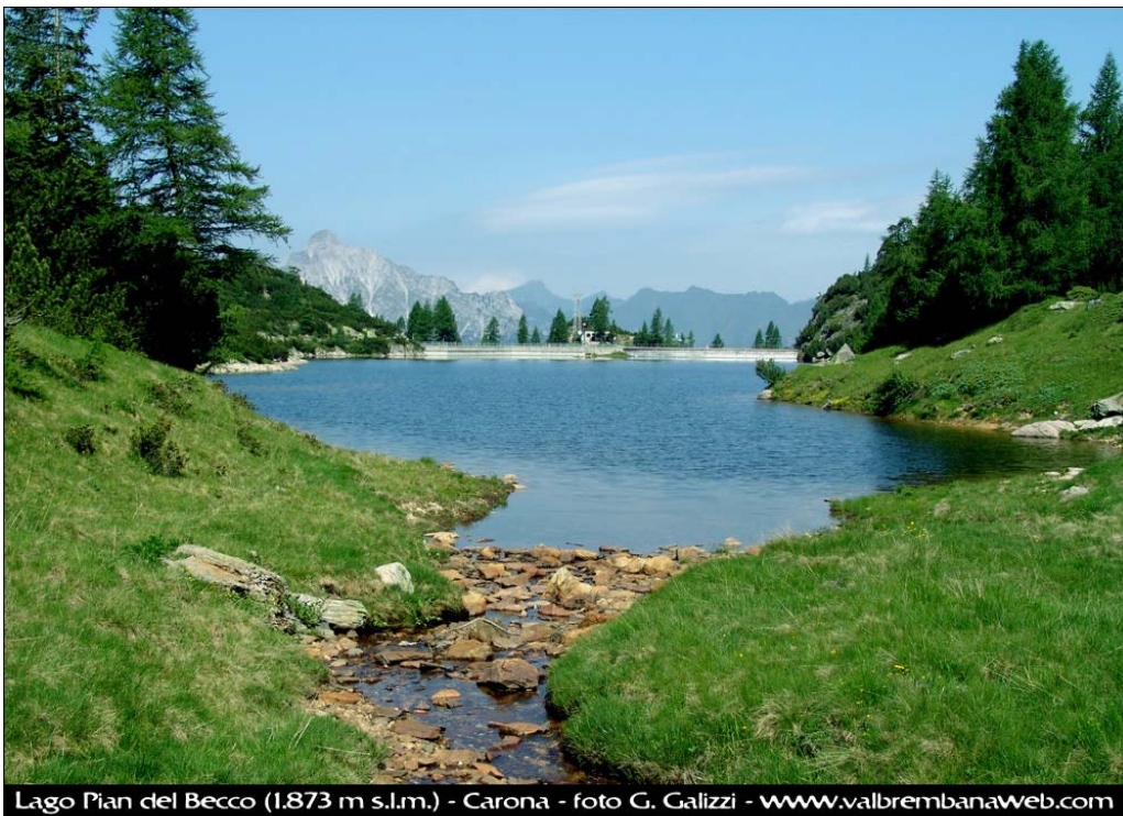
Fotografia n. 26