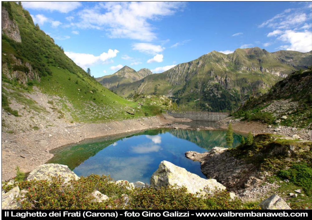
Il Laghetto dei Frati (Carona)