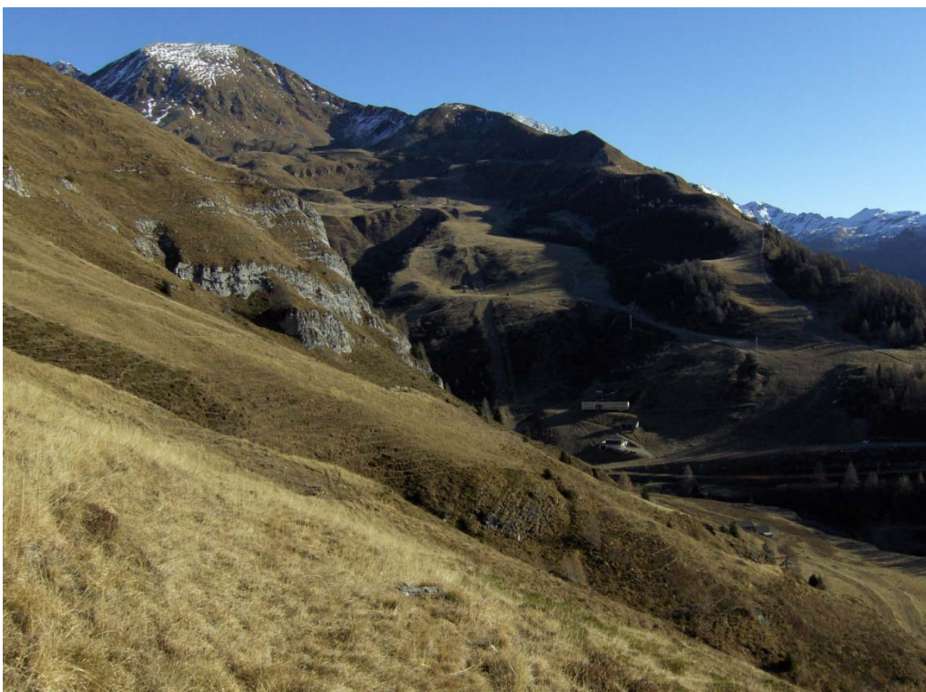
Fotografia n. 15