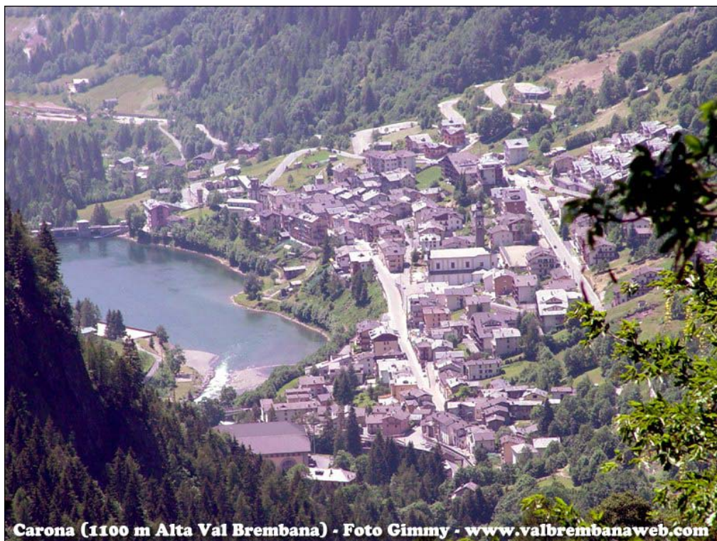
Fotografia n. 2