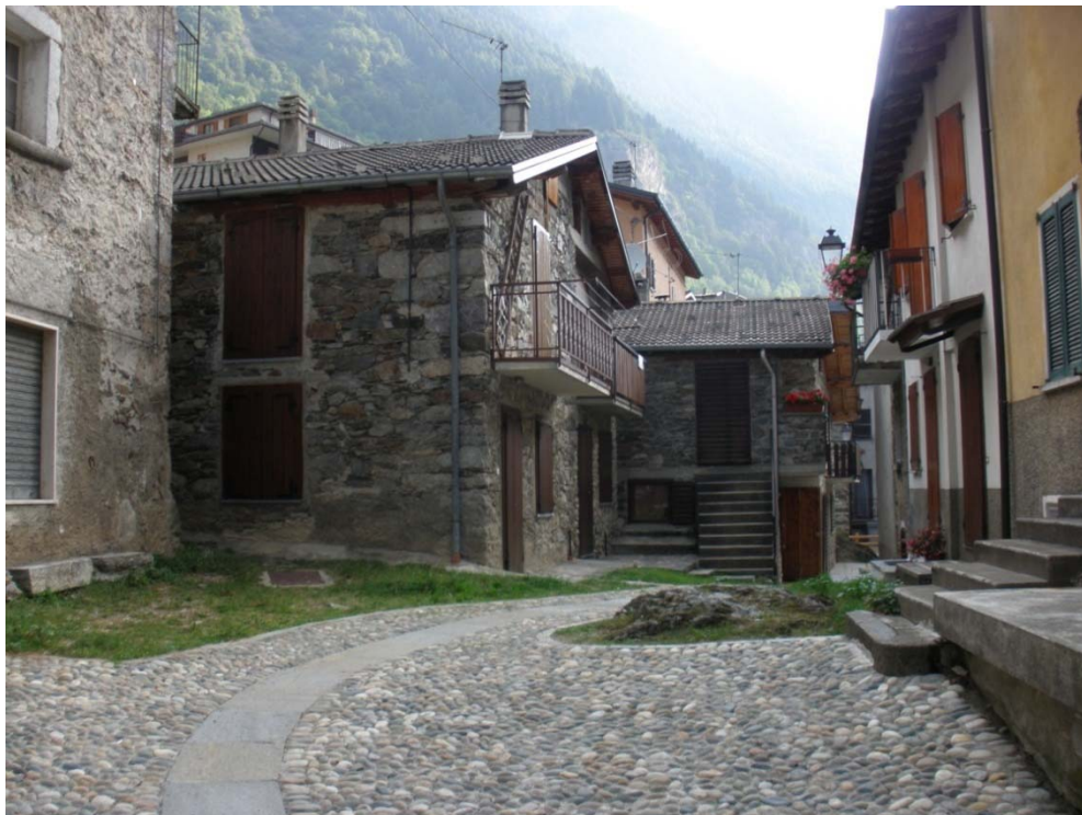
Fotografia n. 10