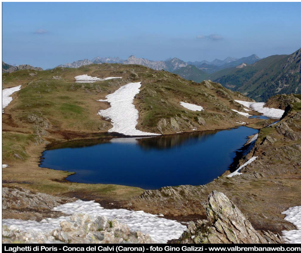
Fotografia n. 22