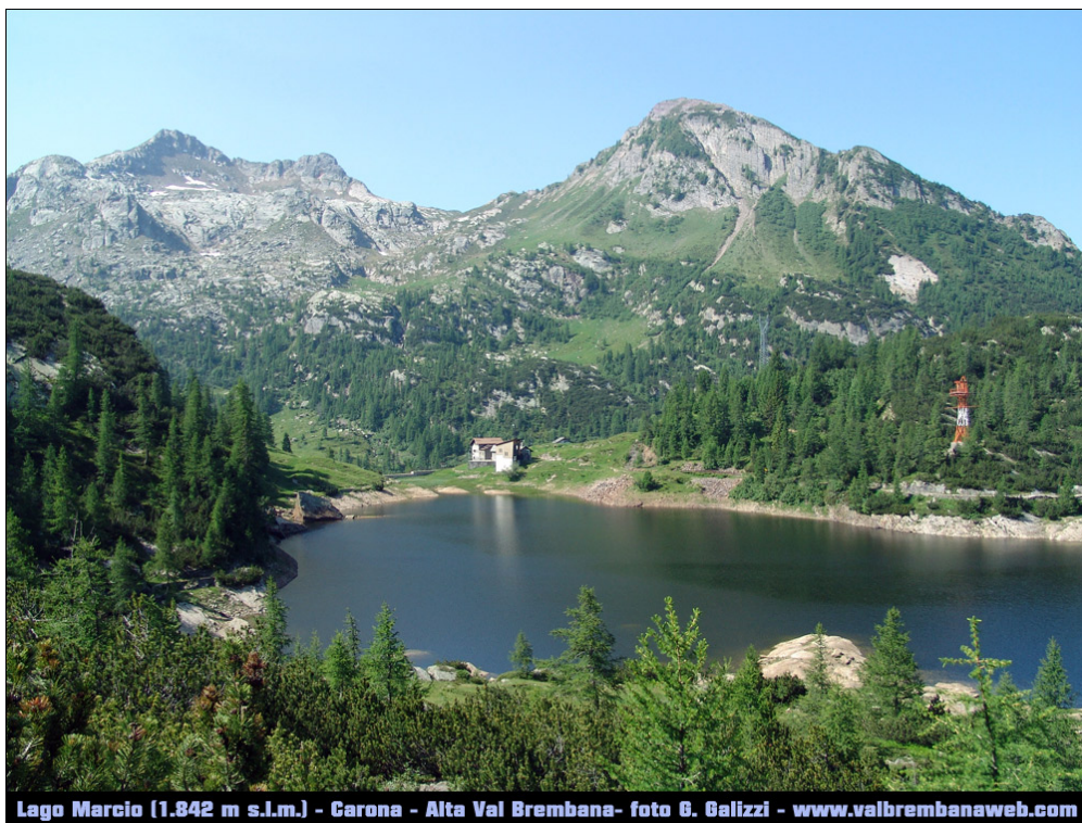
Fotografia n. 27