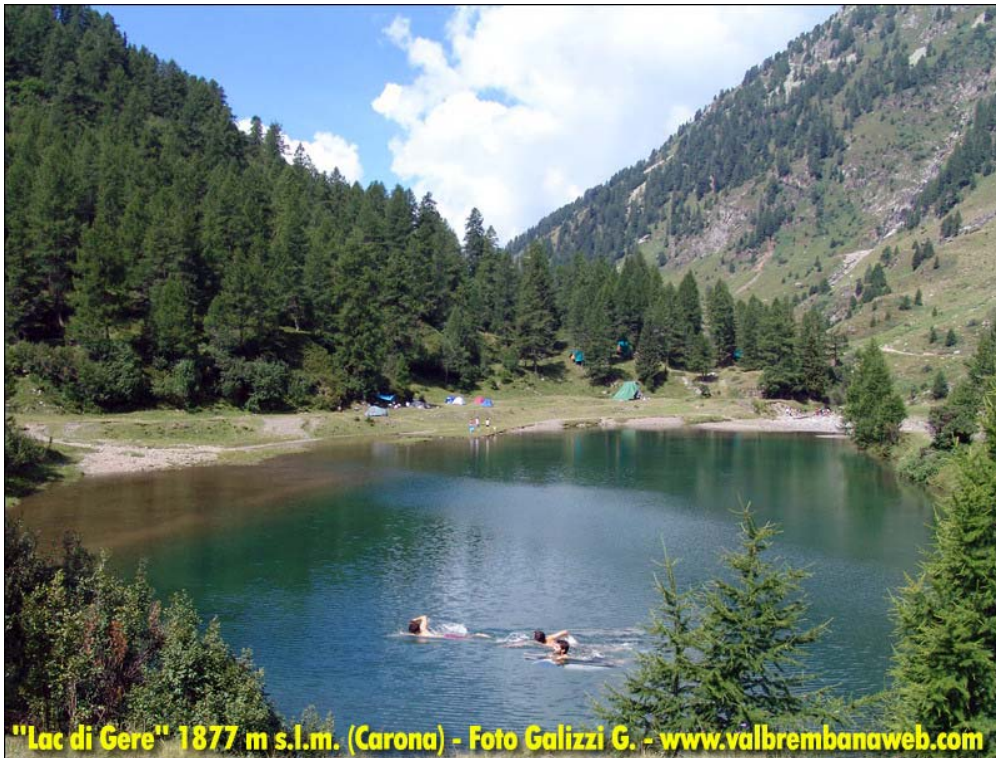
Fotografia n. 21