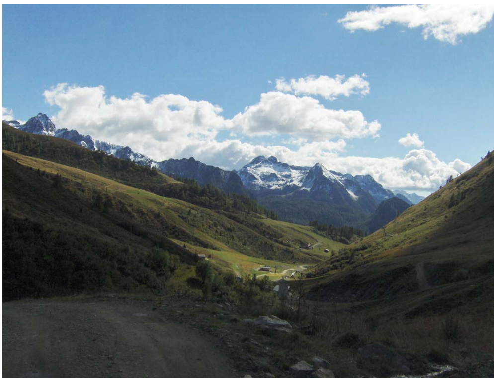
Fotografia n. 16