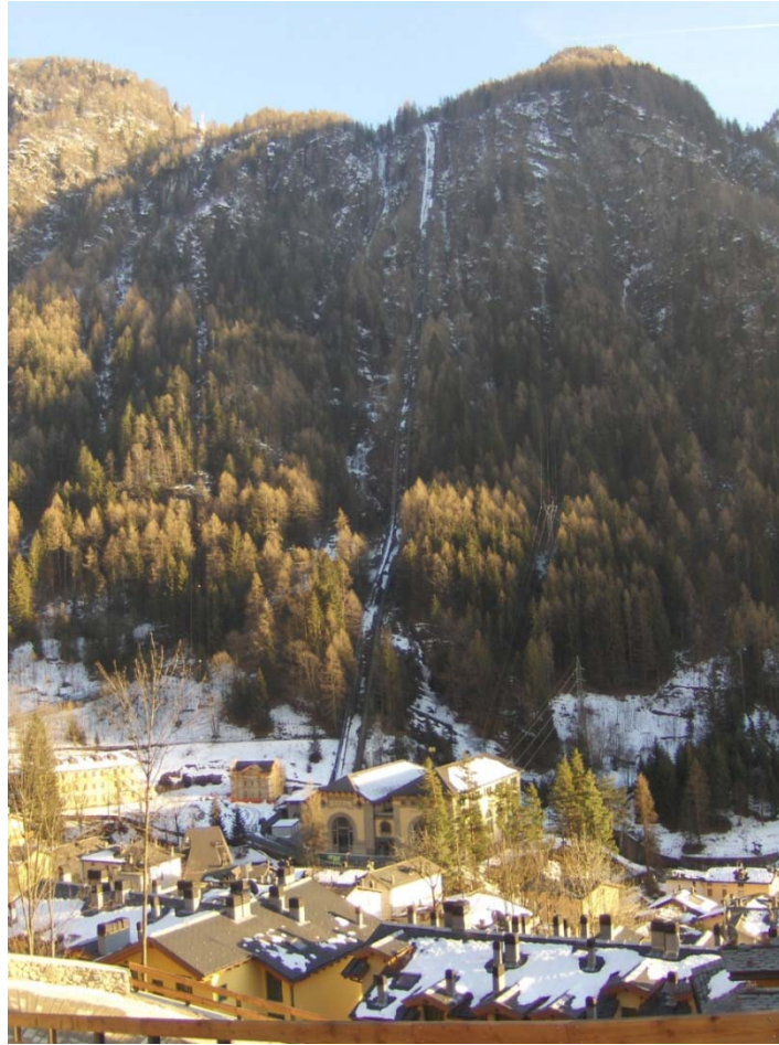
Fotografia n. 3