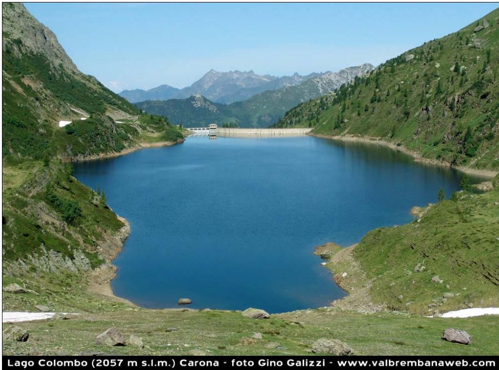
Fotografia n. 25