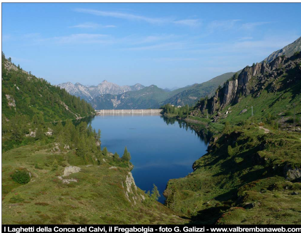
I Laghetti della Conca del Calvi, il Fregabolgia