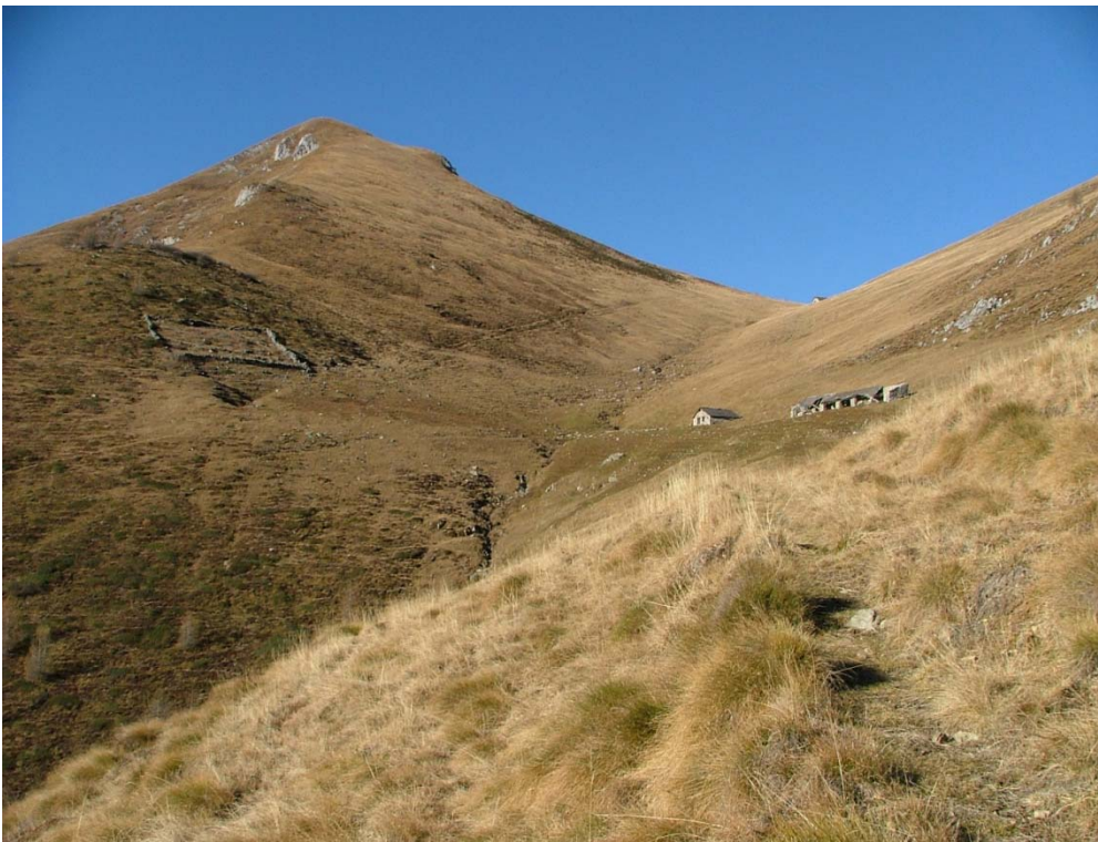
Fotografia n. 12