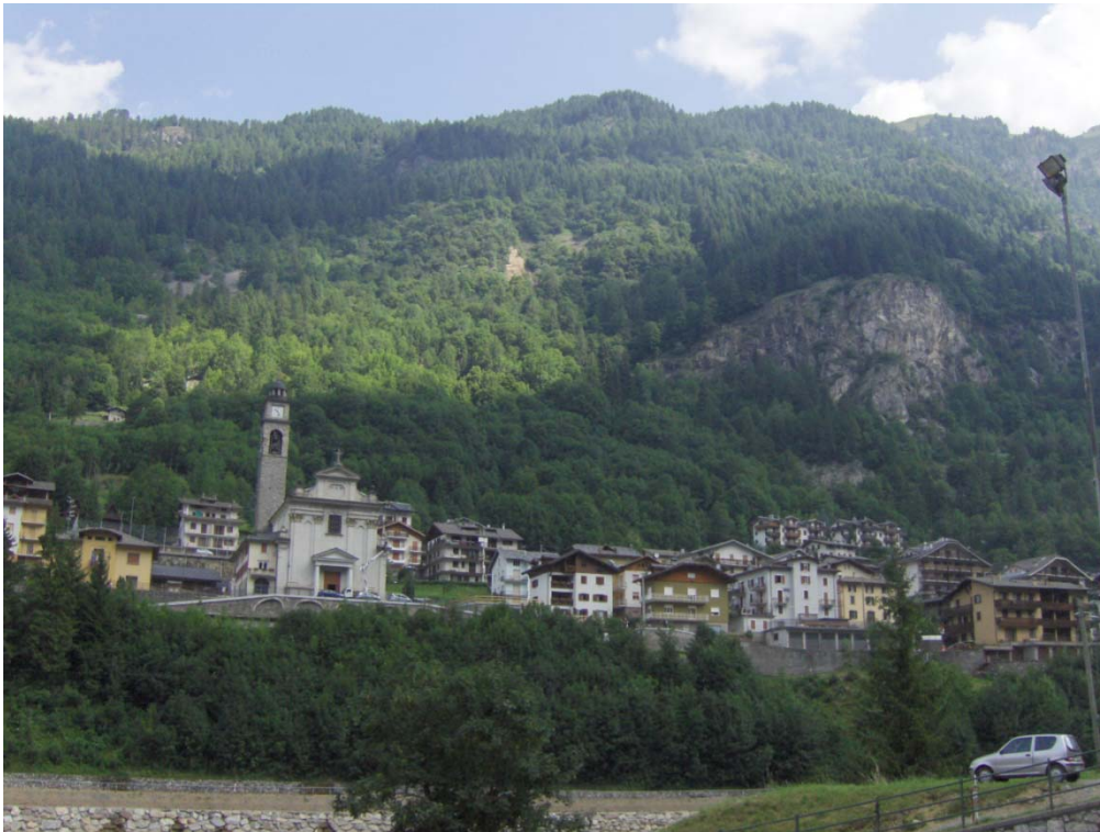
Fotografia n. 4