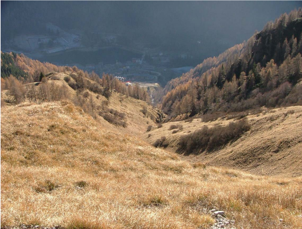
Fotografia n. 13