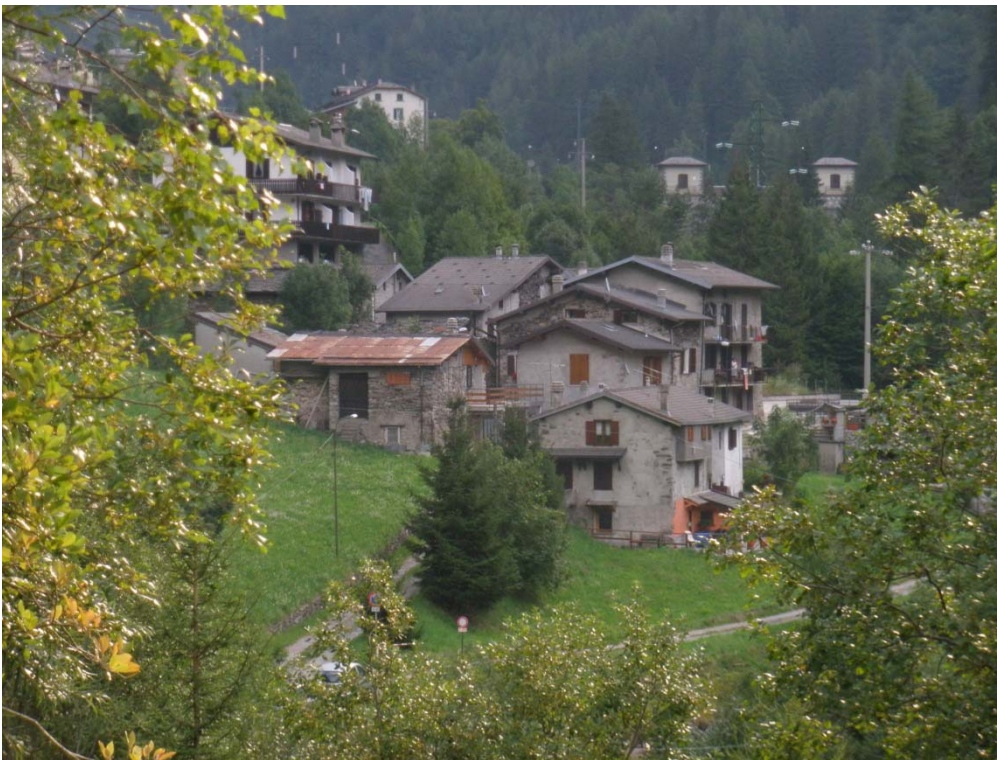
Fotografia n. 8