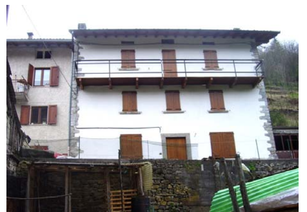
n. 8 (casa eretta nel 1854)