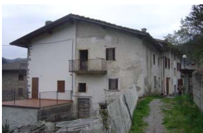
Cono di ripresa n. 1