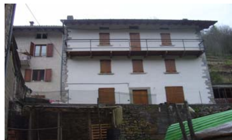
Cono di ripresa n. 2