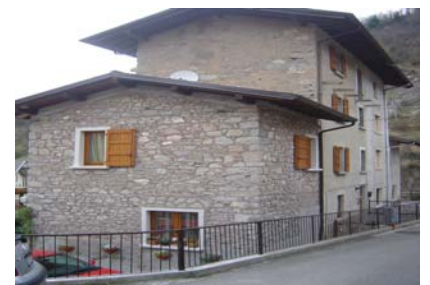
Cono di ripresa n.3