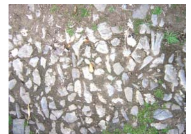
n. 6 acciottolato