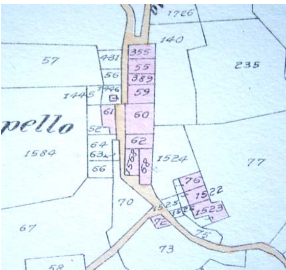
soglia - 1902-1935