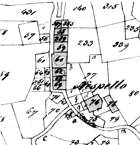
soglia - 1854