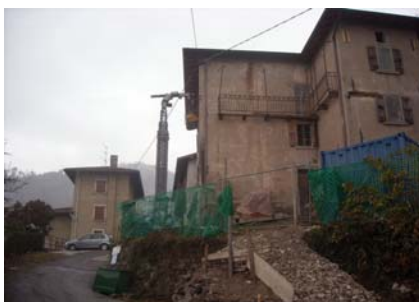
Cono di ripresa n. 1