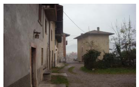
Cono di ripresa n.3