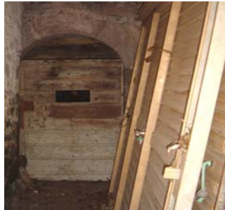
n. 3, portale stile XII-XIII