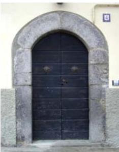
n. 3, portale