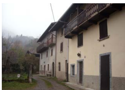
Cono di ripresa n. 2