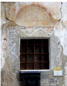
n. 4 dettagli decorativi XVI-XVII e XVIII