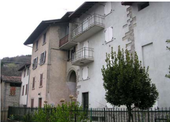
nn. 5, 6, 7, 8