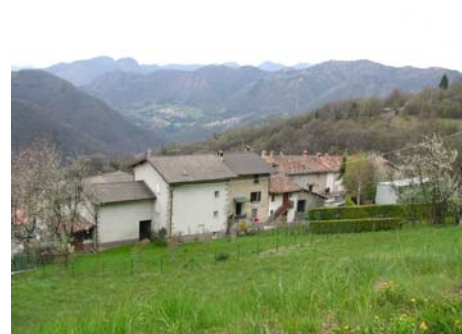
Cono di ripresa n.3