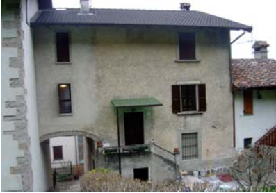
nn. 6, 7