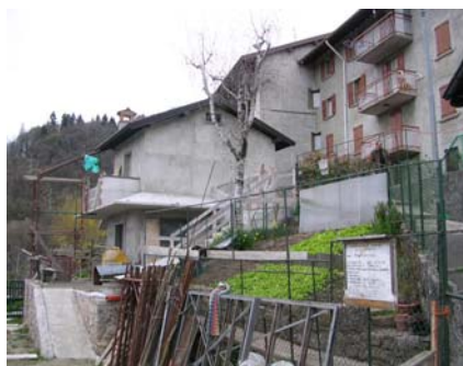
Cono di ripresa n. 2