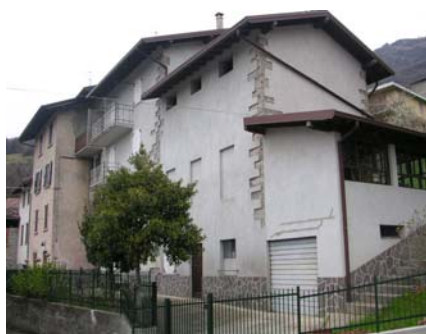
Cono di ripresa n. 1