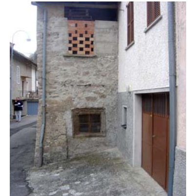
nn. 6, 7