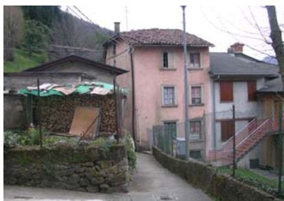
Cono di ripresa n. 2