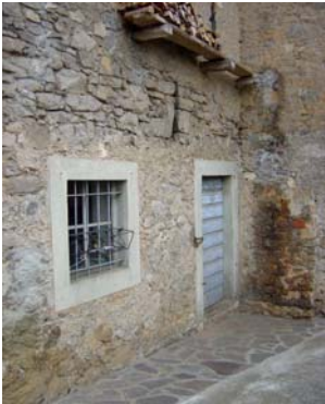
n. les 8