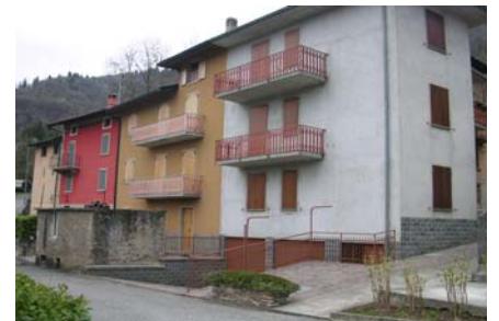
Cono di ripresa n. 3