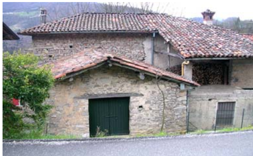
n. les 8