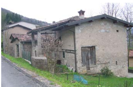
Cono di ripresa n. 1