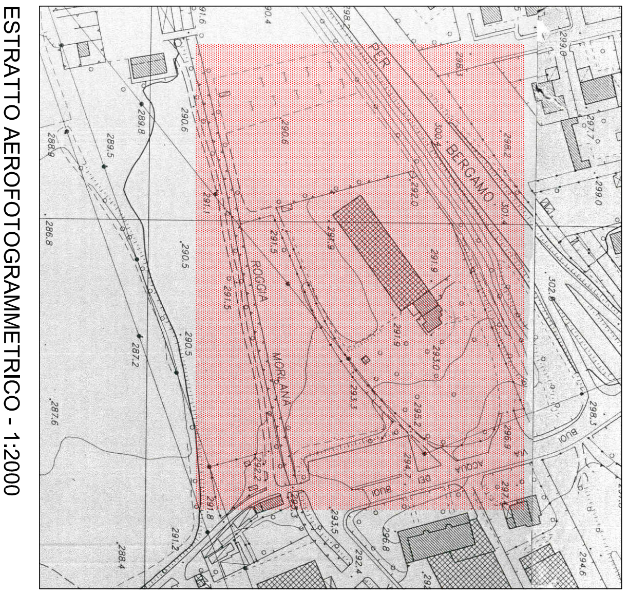
ESTRATTO AEROFOTOGRAFOMETRICO - 1:2000