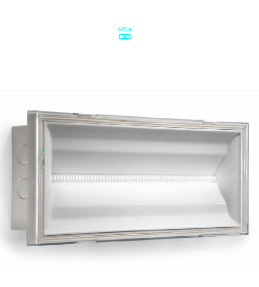
PARTICOLARE CORPO ILLUMINANTE TIPO EATON NEXITECH LED 11W 1,5h AT - 150lm - IP65