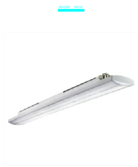
PARTICOLARE CORPO TIPO GEWISS SMART (3) GWS3136T CON RIFLETTORE TRASPARENTE 2.508lm 20W - IP66