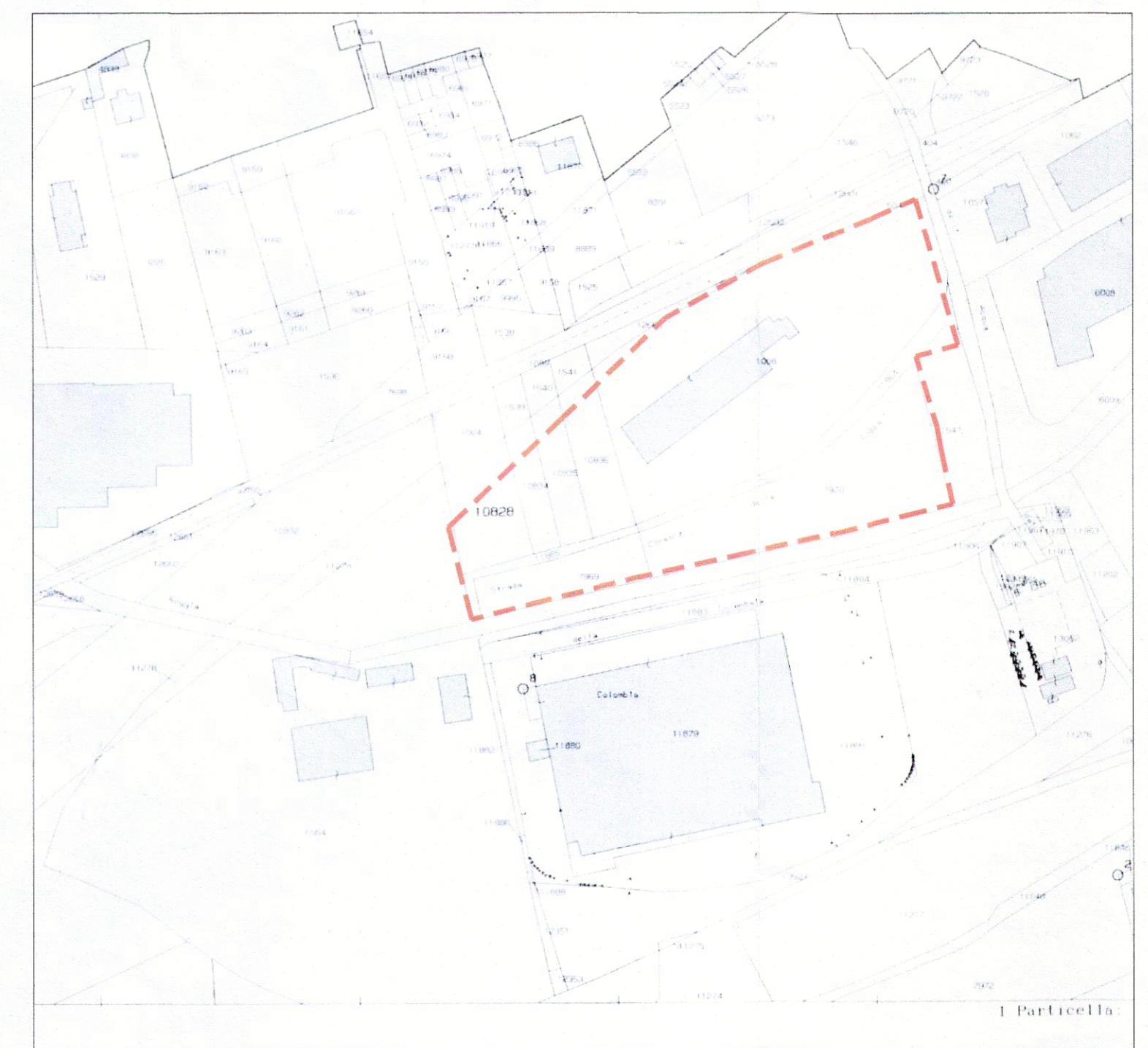
ESTRATTO MAPPA - 1:2000