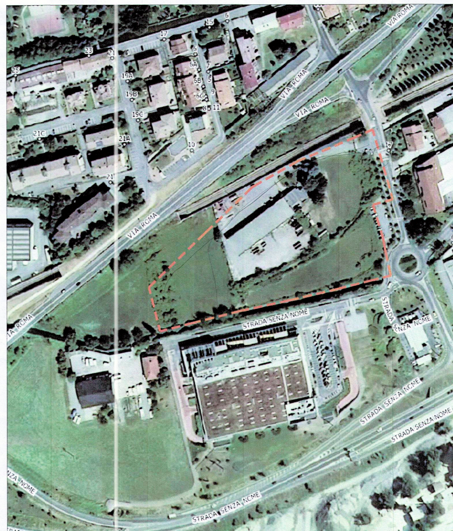
ESTRATTO ORTOFOTO - 1:2000