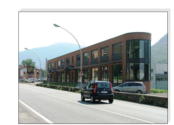
Tavola numero 3