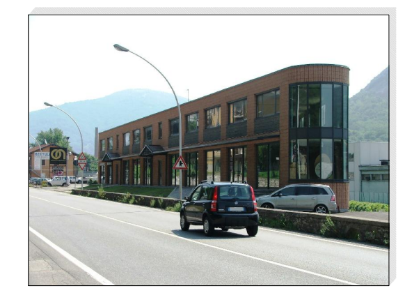
Tavola numero 4B

AREA OGGETTO NUOVO CONVENZIONAMENTO DI PROPRIETA' DEI RICHIEDENTI VARIANTE P.A. III/9