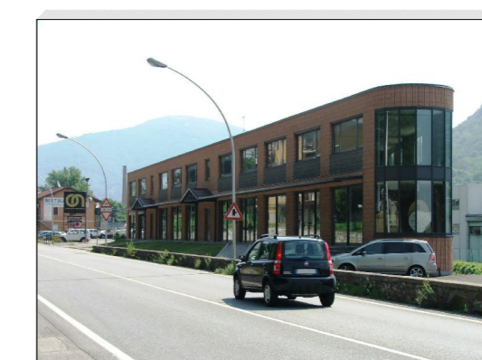
Tavola numero 08