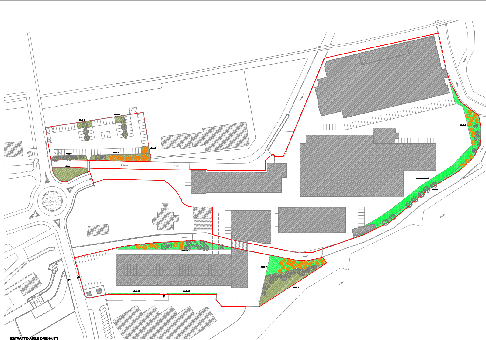
ESTRATTO AREE DRENANTI