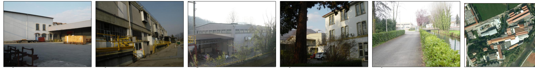
presa 5 presa 6 presa 7 presa 8 presa 9 presa aerea