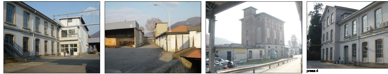
presa 1 presa 2 presa 3 presa 4