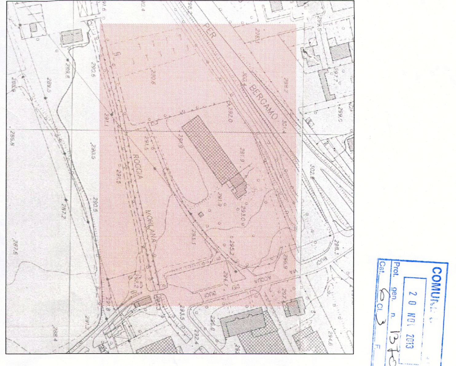
ESTRATTO AEROFOTOGRAMMETRICO - 1:2000