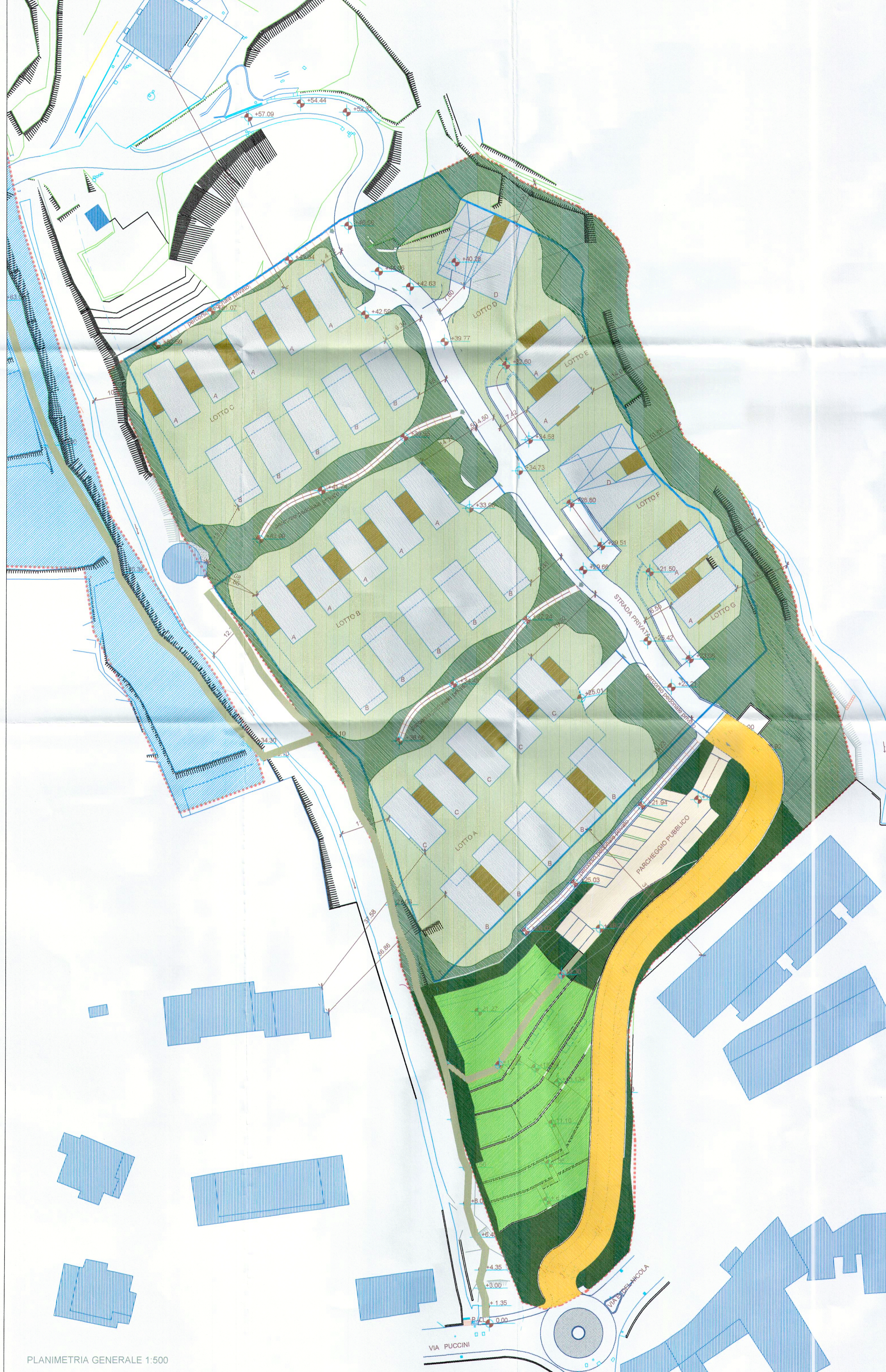
PLANIMETRIA GENERALE 1:500