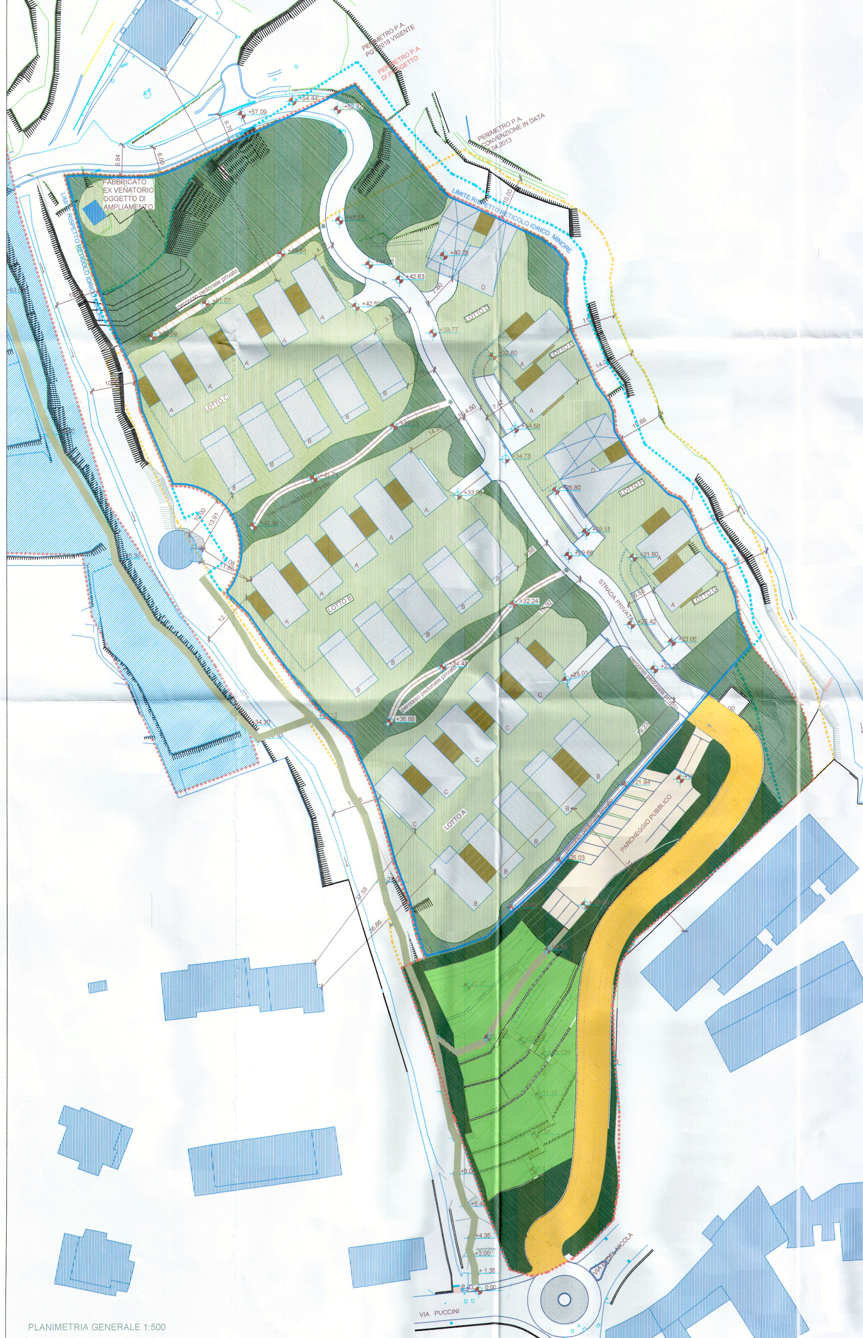
PLANIMETRIA GENERALE 1:500