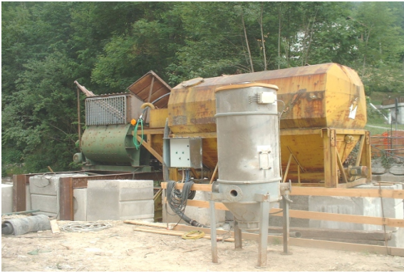
Silos di alimentazione del cemento