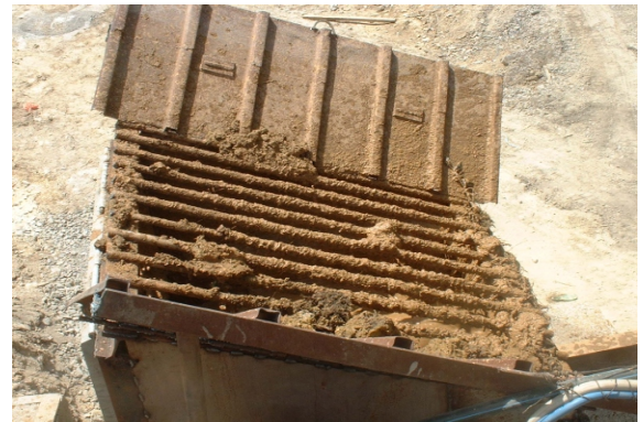
Vasca di miscelazione e fluidificazione terra-acqua con griglia in testa (vedi foto)