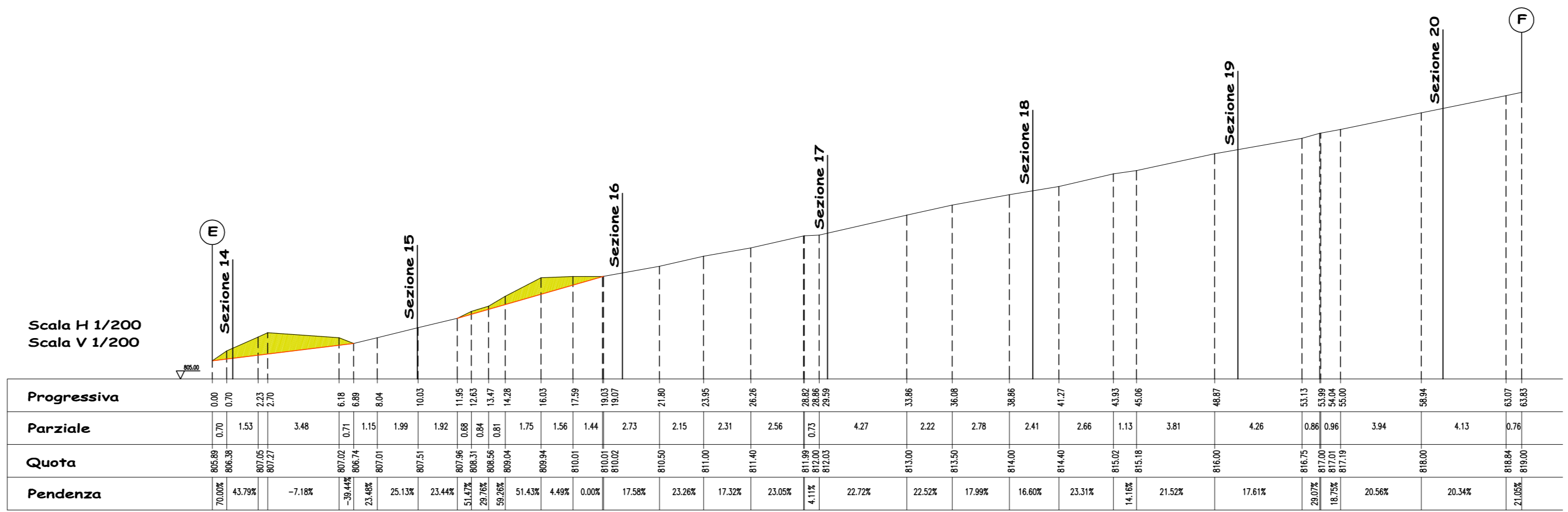
PROFILO E-F Scala H 1/200 Scala V 1/200 scala 1:200