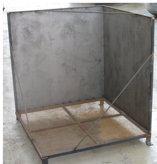
IMMAGINE BERSAGLIO RADAR