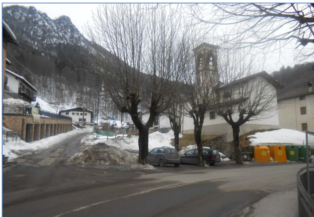
Fotografia n. 12