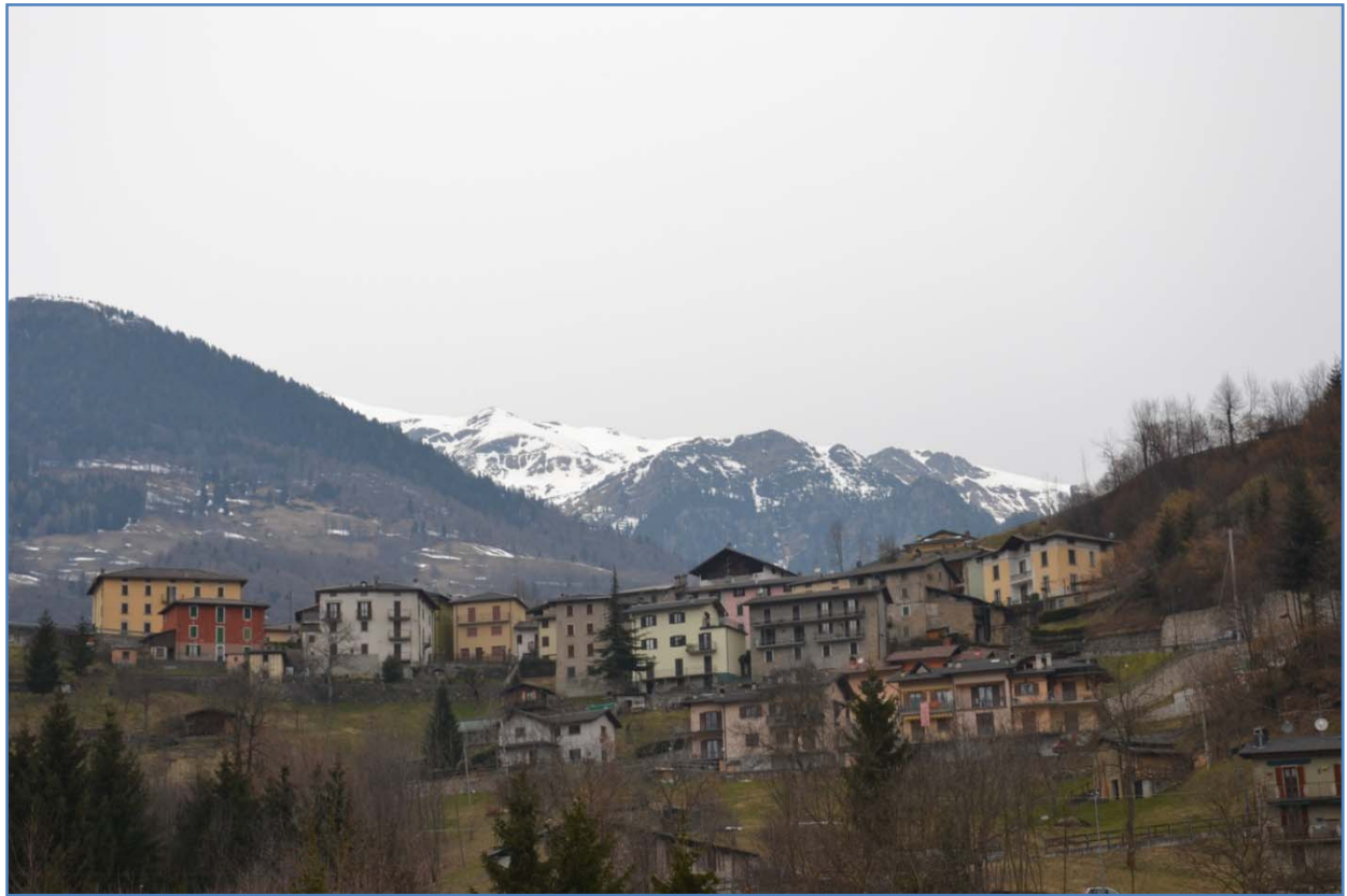
Fotografia n. 6