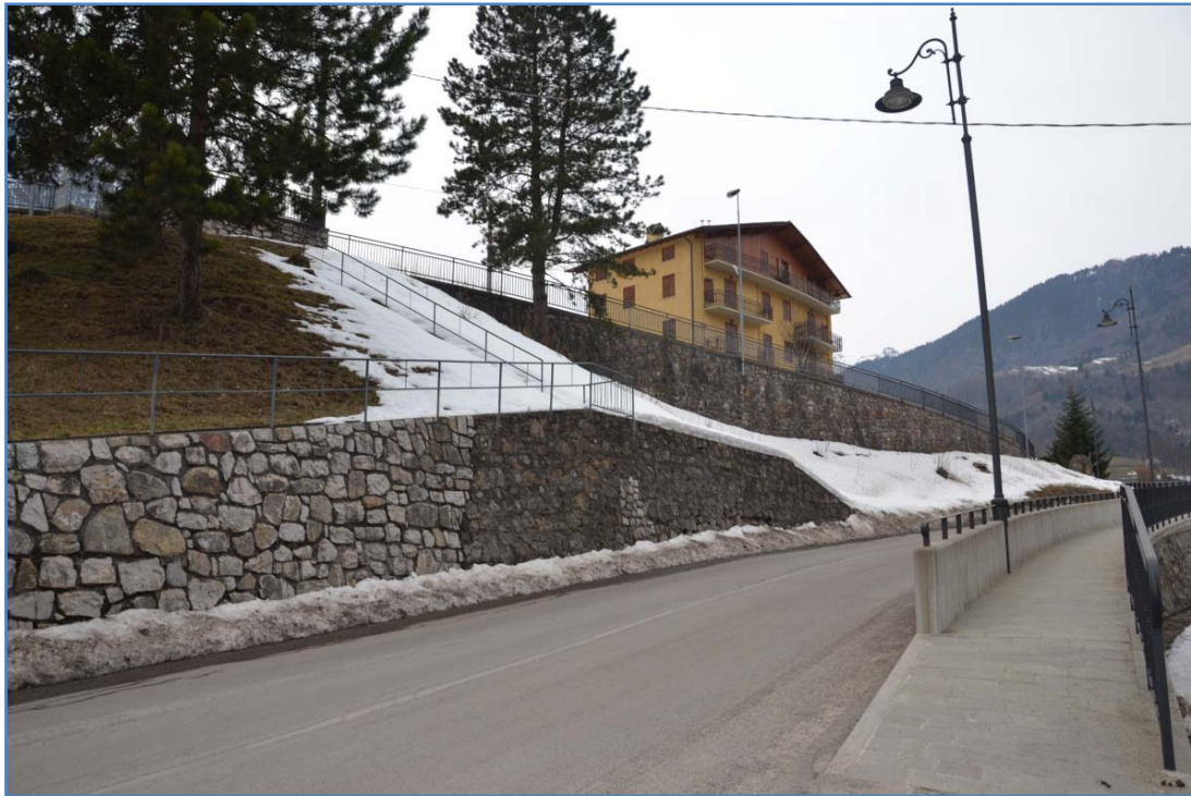
Fotografia n. 13