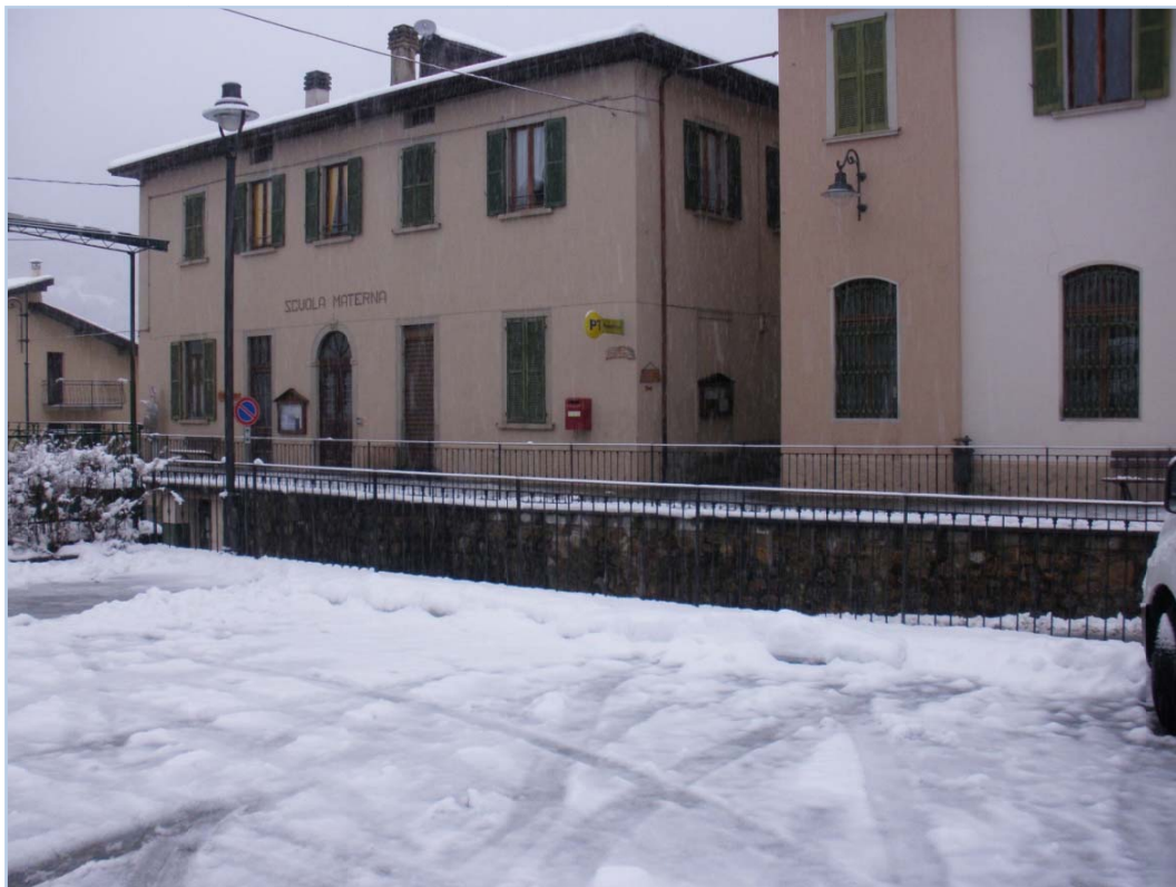
Fotografia n. 10