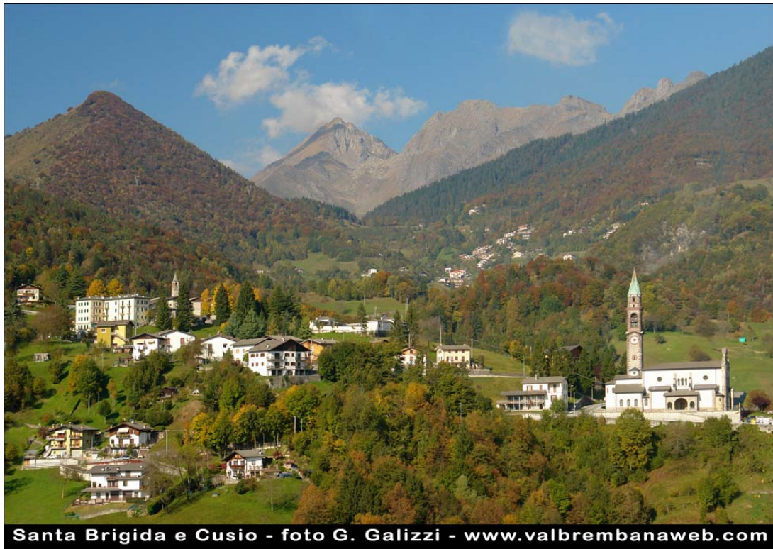
Santa Brigida e Cusio