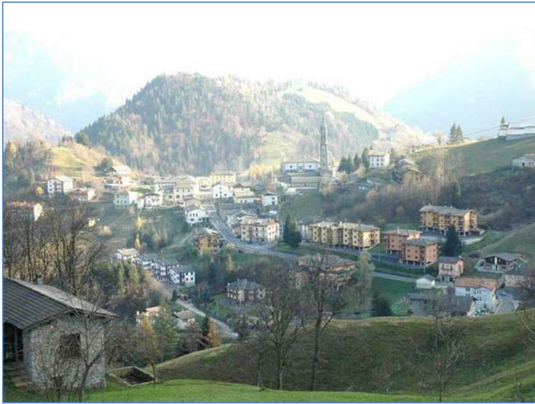
Fotografia n. 2