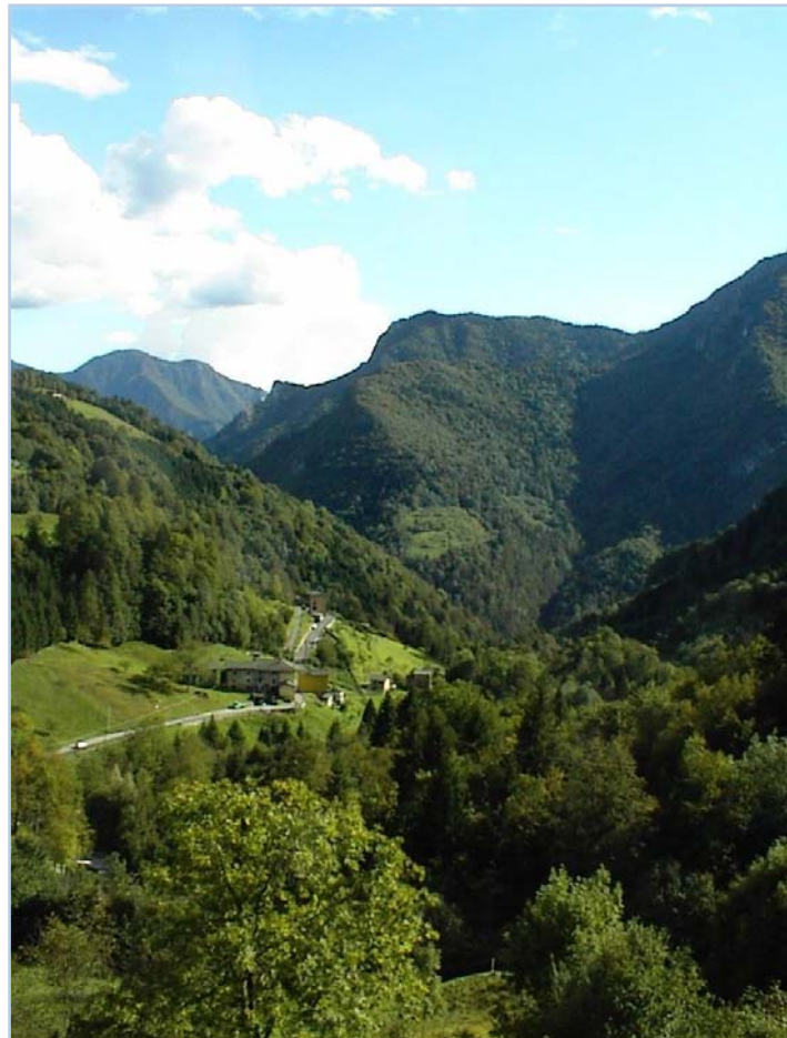
Fotografia n. 16