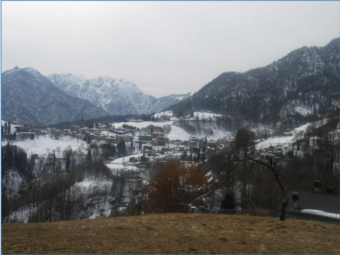
Fotografia n. 3