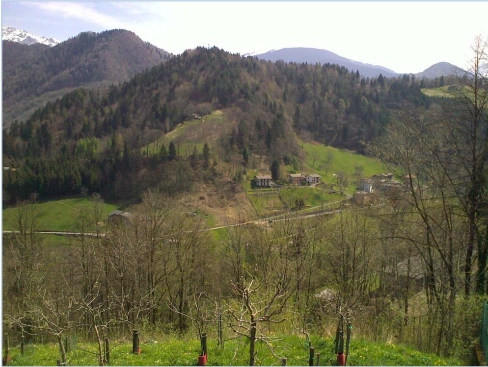
Fotografia n. 15