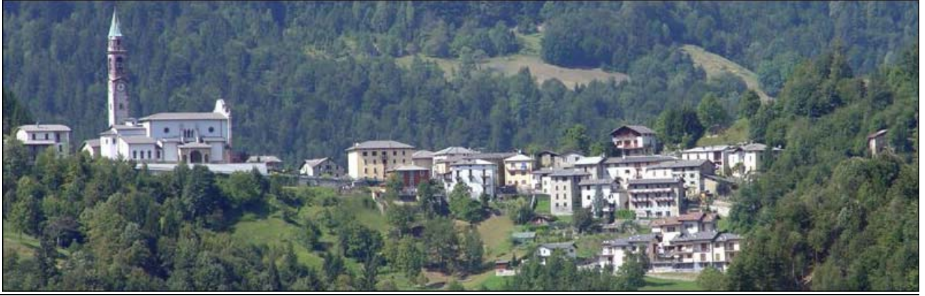
Fotografia n. 5