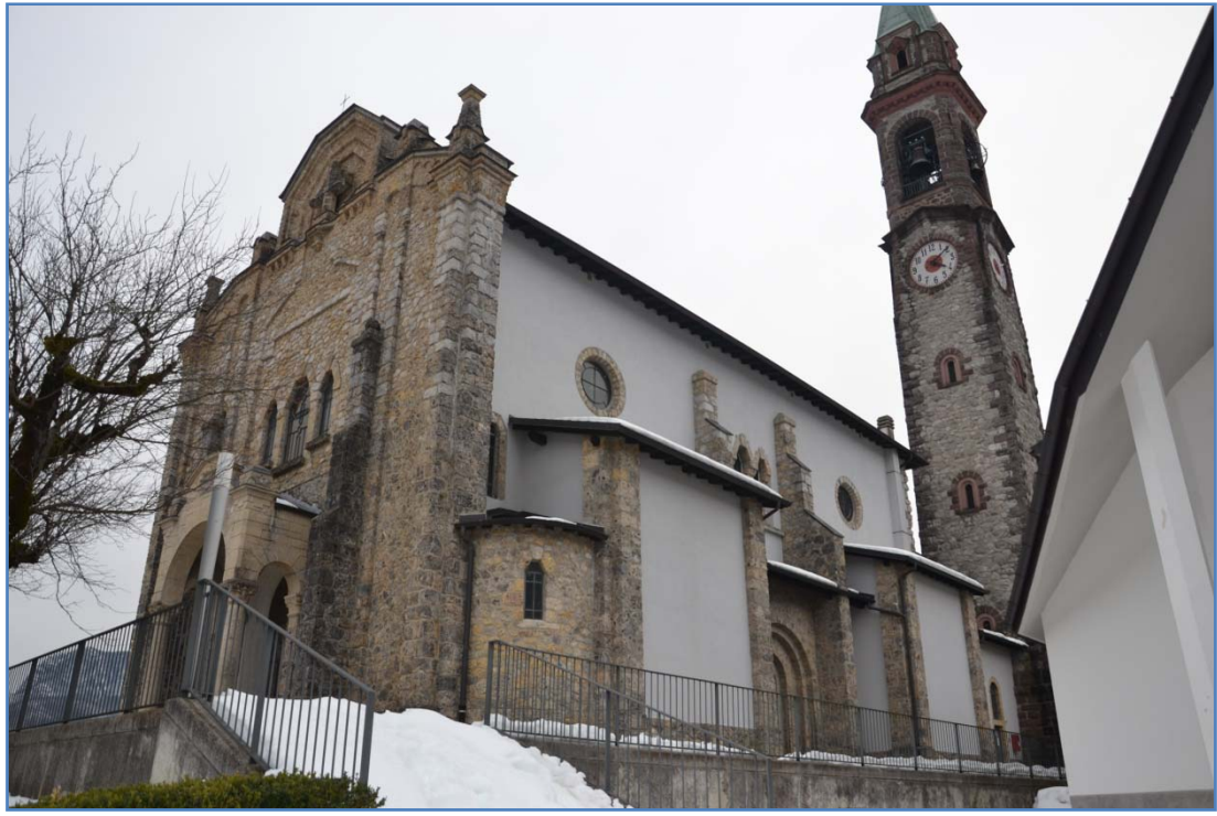
Fotografia n. 7