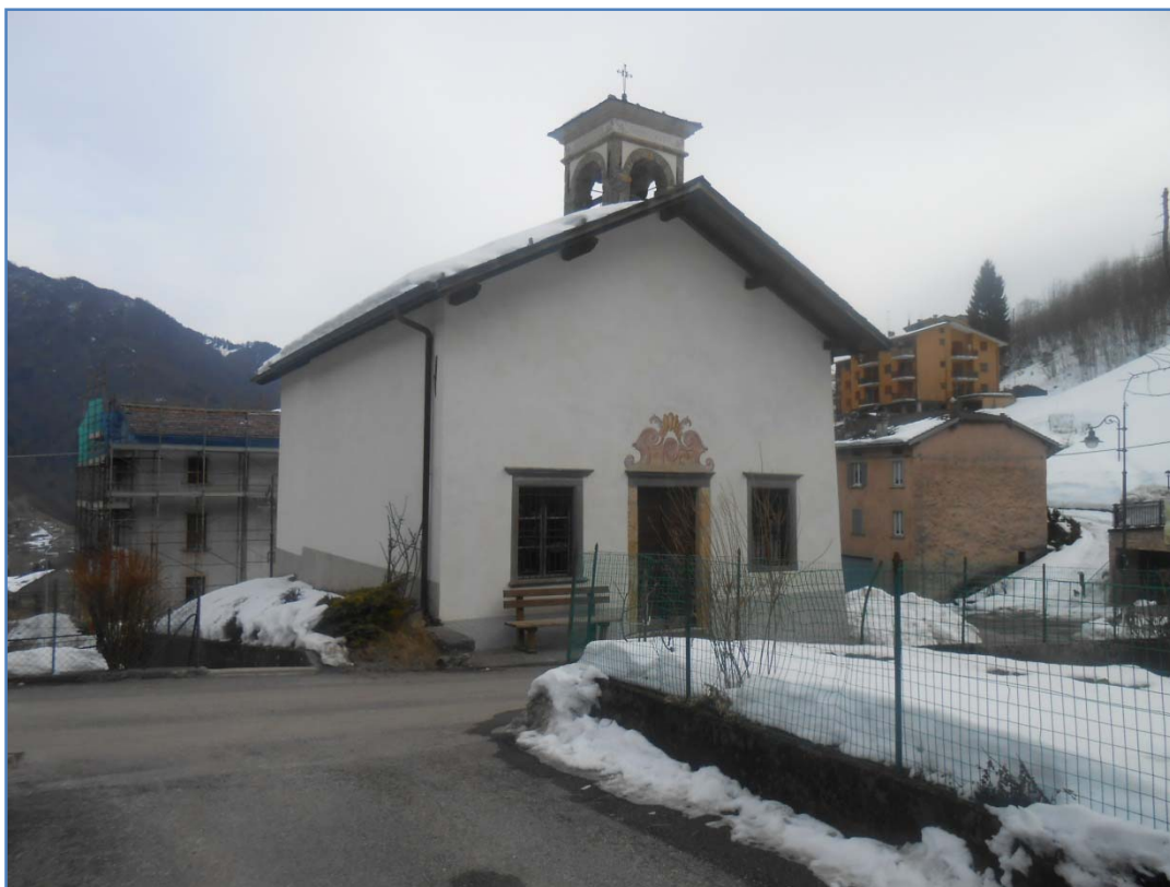
Fotografia n. 11