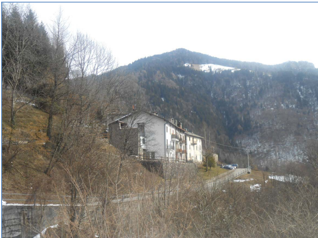
Fotografia n. 14