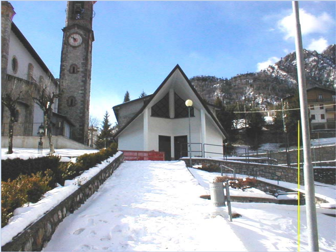
Fotografia n. 9