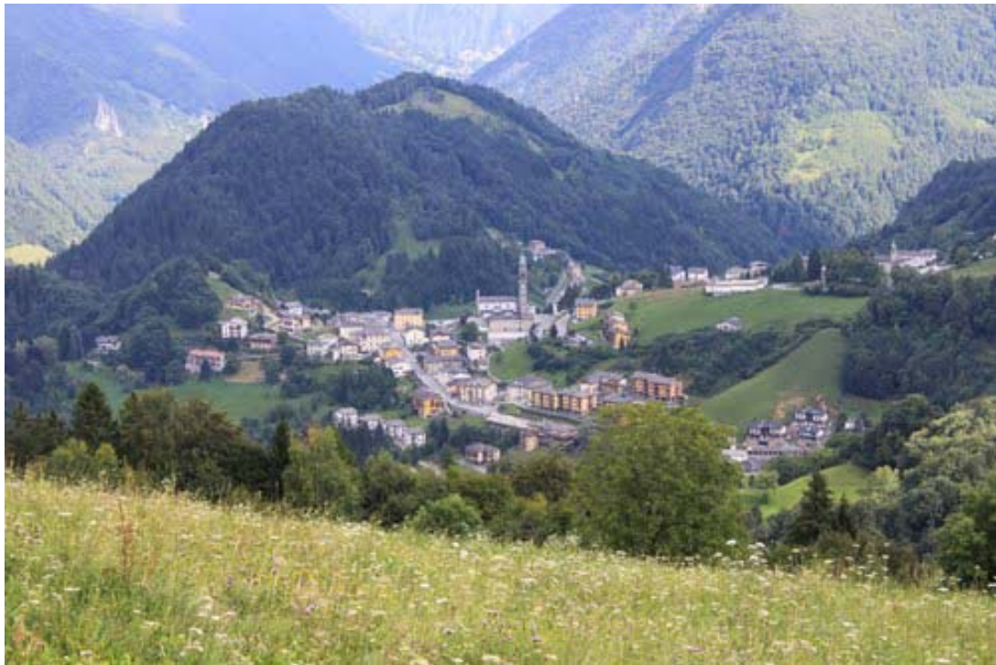
Fotografia n. 4