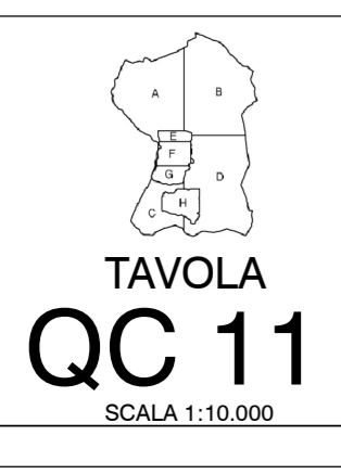
TAVOLA QC 11 SCALA 1:10.000

Architetto Gianmarco Locati Via P. Ripamonti, 9 24121 Bergamo Tel. e fax 035/209498 C.F. 1177486030108 P.IVA 0243201016