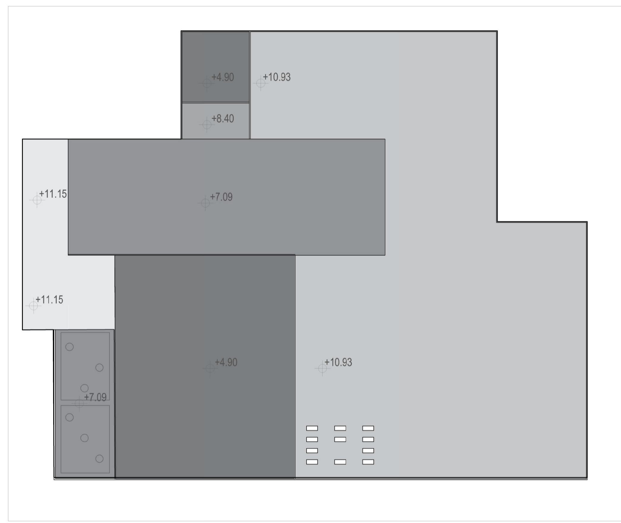
SCHEMA COPERTURA Scala 1:500