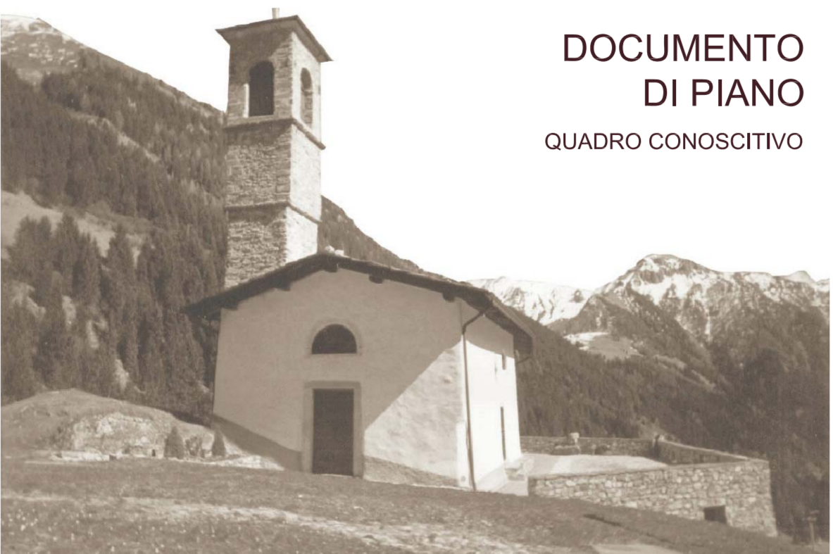
TAVOLA 3 01a